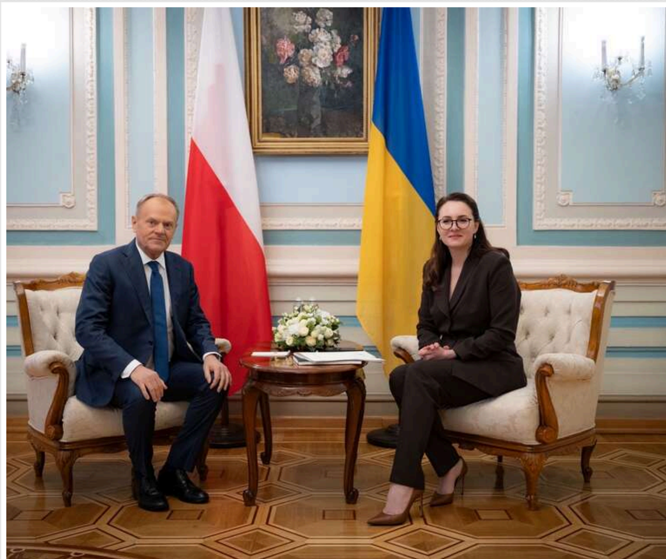
Пріоритет – ППО та зброя: Юлія Свириденко узгодила з Дональдом Туском нові кроки військової допомоги

Читати на руськом Read in English Додати як бажане джерело в Google