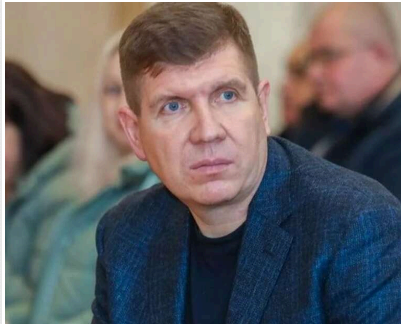
Реформатор з вироком: засуджений за хабарництво нардеп Гунько розроблятиме закони для адвокатури під егідою Кабміну

Народний депутат України Анатолій Гунько, якого у березні 2025 року Вищий антикорупційний суд визнав винним у підбурюванні до надання хабаря та шахрайства, і якому нещодавно Національне антикорупційне бюро України вручило ще одну підозру, увійшов до складу урядової робочої групи з удосконалення законодавства у сфері адвокатури в рамках Дорожньої карти з питань верховенства права, яку особисто затвердила прем'єр-міністерка Юлія Свириденко.