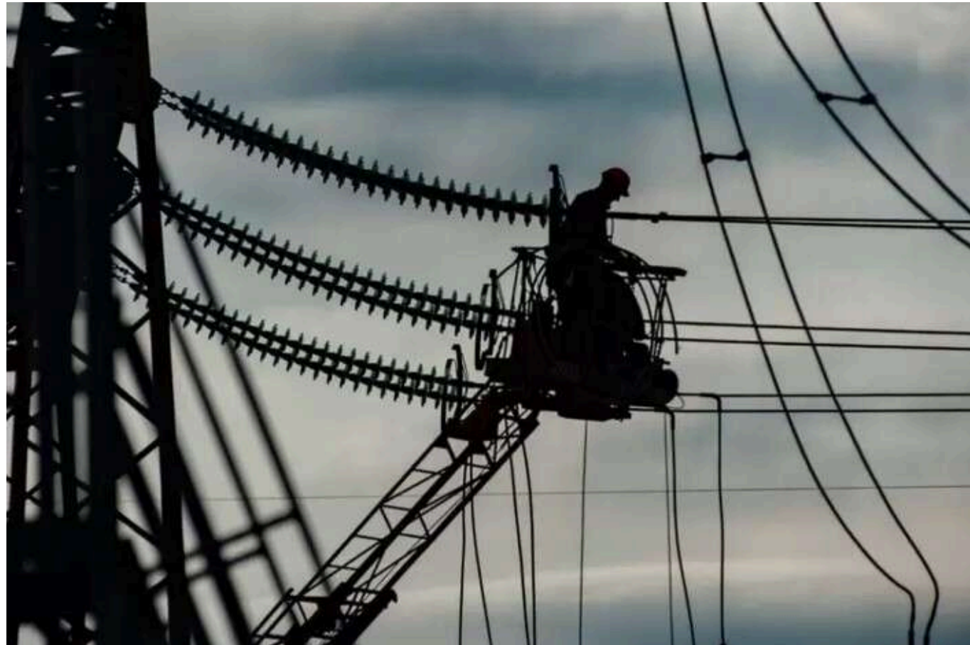
У Дії розпочали прийом заявок на 20 тисяч гривень доплати для енергетиків та комунальників: як отримати кошти

У Дії розпочався прийом заявок на доплату в розмірі 20 тис. грн для працівників аварійно-відновлювальних бригад, – Юлія Свиріденко.