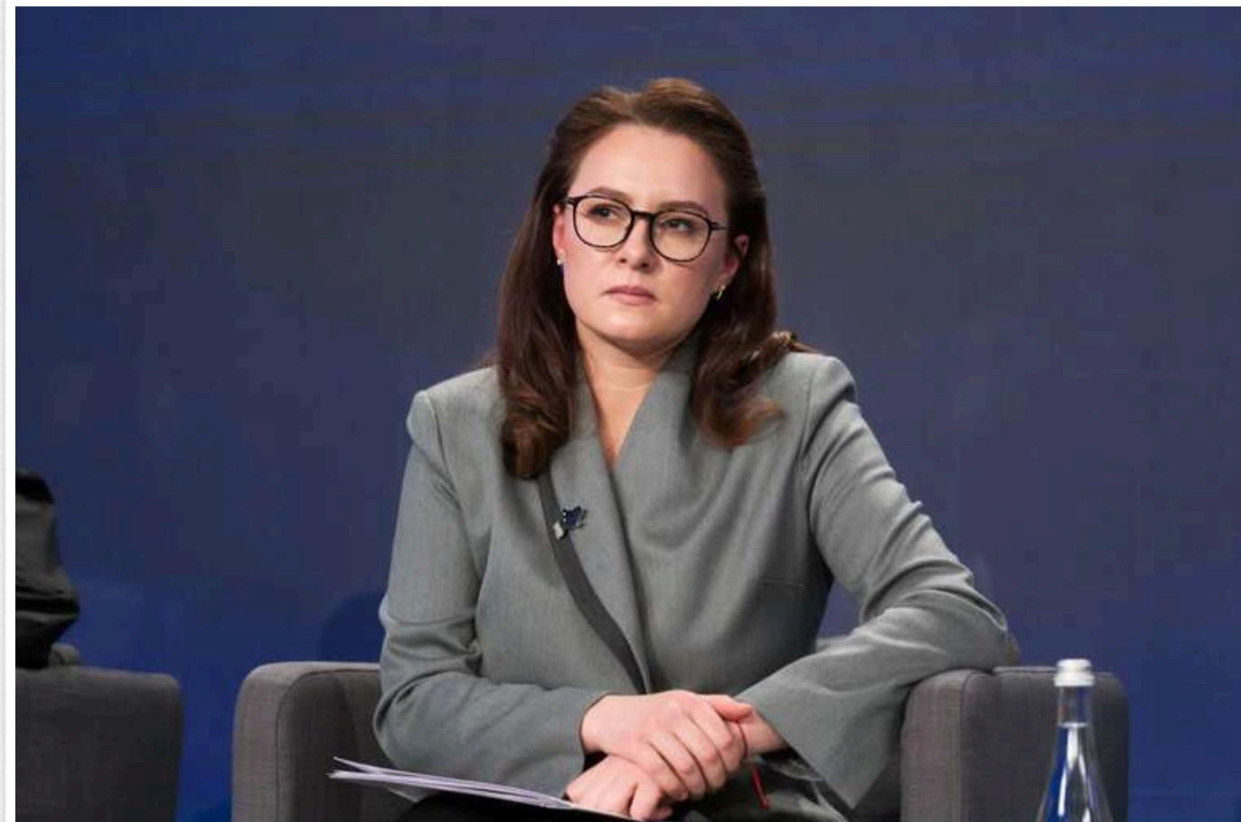
Свириденко підтвердила, що обов'язковий ПДВ для підприємців поки не реєструватимуть: деталі резонансного законопроекту, який вимагає МВФ

Кабінет Міністрів України у лютому 2026 року не подаватиме проект закону про обов'язкову реєстрацію платником податку на додану вартість (ПДВ) для платників єдиного податку (фізичних осіб-підприємців, ФОП) з річним оборотом понад 1 млн грн. Цей документ є необхідним для підписання угоди між Україною та Міжнародним валютним фондом (МВФ) щодо нової програми фінансування.