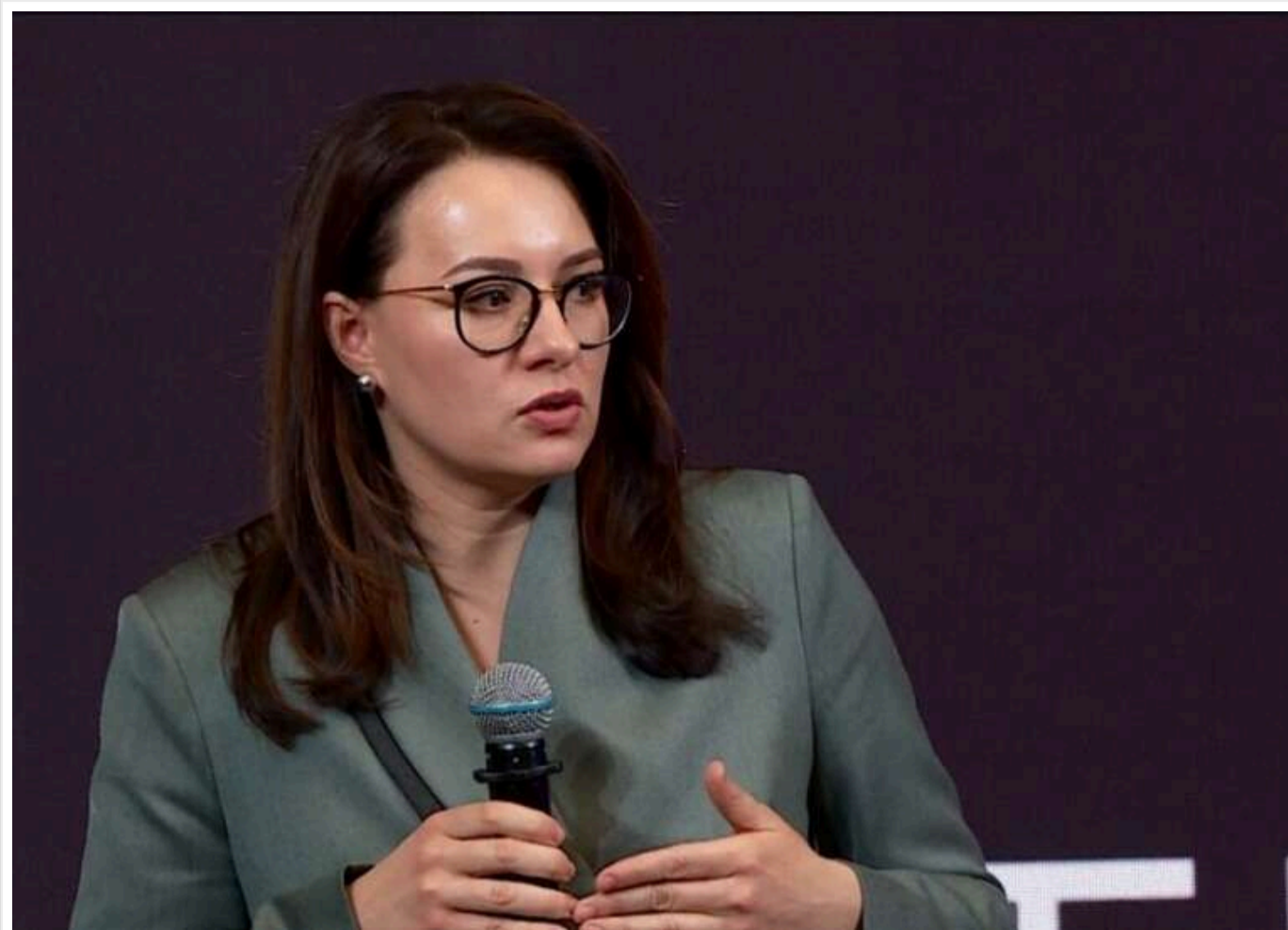
Свириденко анонсувала старт продажу санкційних активів в Україні: першим піде ТЦ «Оушен Плаза»

В Україні незабаром стартують продажі санкційних активів. Це анонсувала прем'єр-міністерка Юлія Свириденко. За її словами, першим з молотка підуть київський торговий центр "Оушен Плаза" (ТОВ "Інвестиційний союз "Либідь"), ТОВ "Миколаївський глиноземний завод", готель у Буковелі ТОВ "АМСТЕЛ-СКІ", а також ТОВ "Демури́нський гірничо-збагачувальний комбінат".