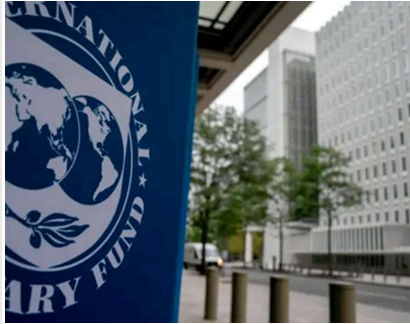
Кінець епохи мораторію: Україна підписала меморандум з МВФ про поступове підвищення тарифів на газ і світло

Уряд України взяв на себе зобов'язання поступово підвищувати тарифи на електроенергію та опалення для населення в рамках нової програми співпраці з МВФ.