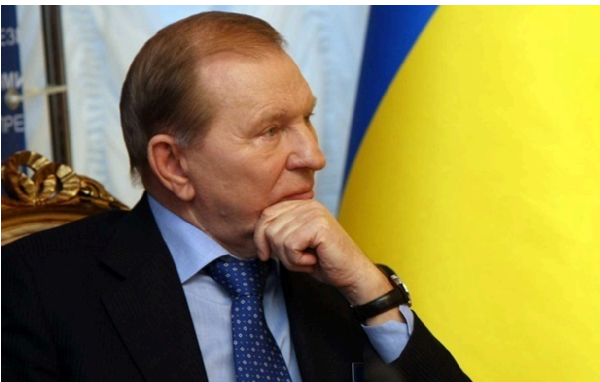
Державну відзнаку отримав другий Президент України Леонід Кучма

Під час виступу у Верховній Раді другий Президент України згадав події 1996 року, коли було ухвалено Основний закон України.