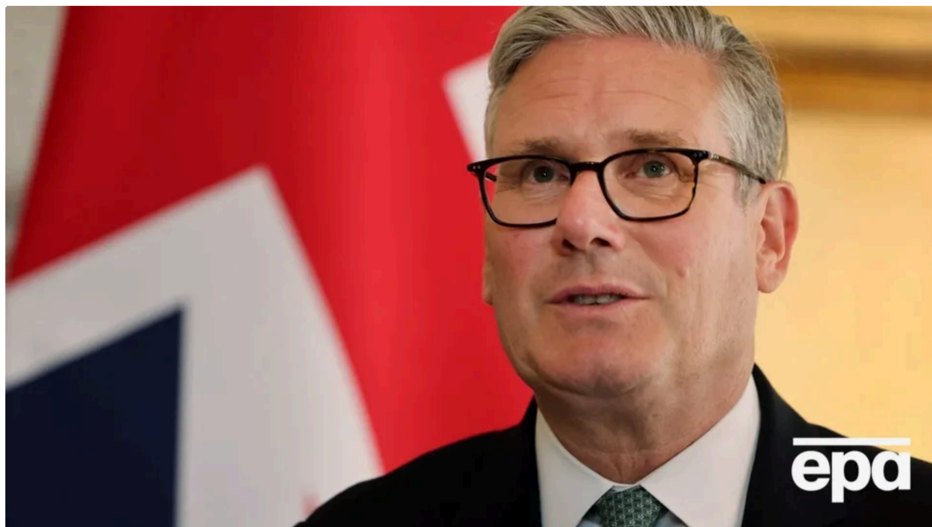
Політик зацікавлений у посаді генсека НАТО

28 червня, 18.26 🗨️ Этот материал также можно прочитать на русском