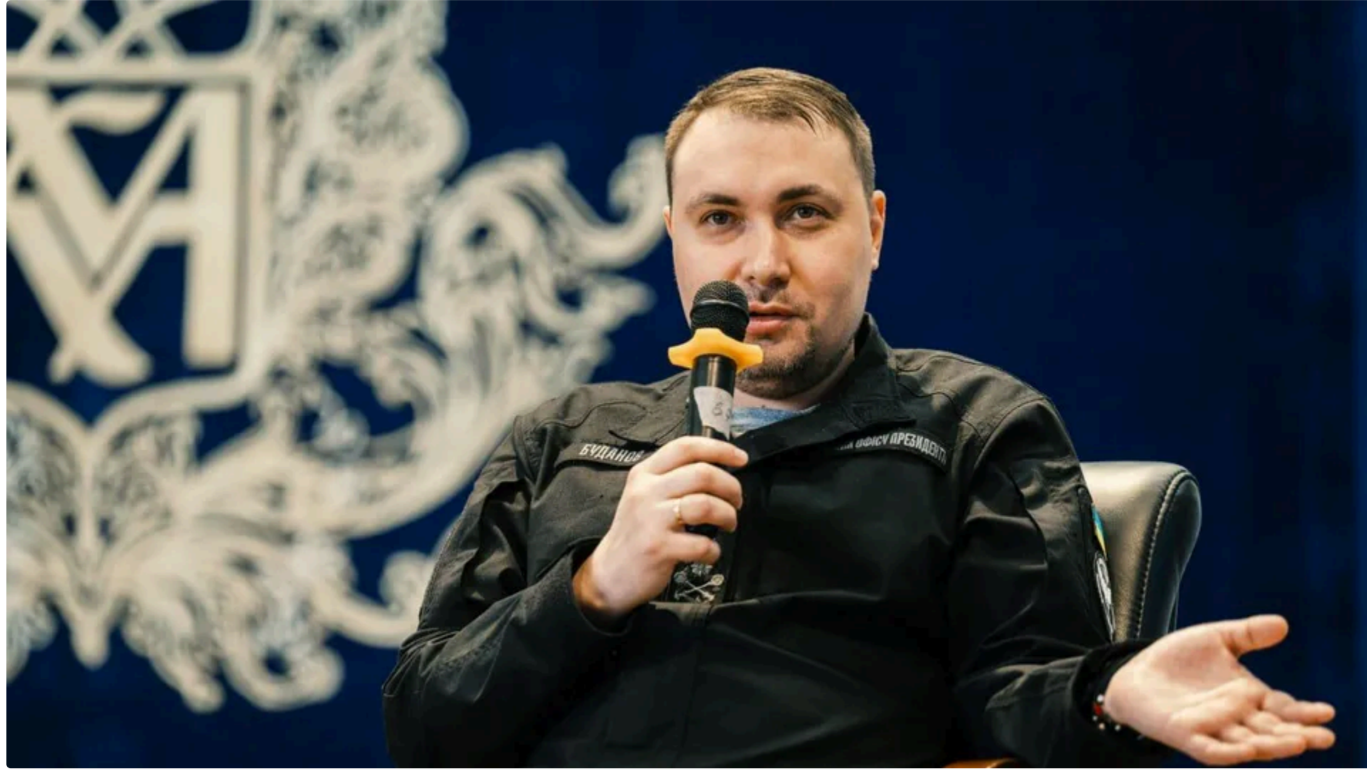
Голова ОП закликав якнайшвидше ухвалити законопроект

28 червня, 18:51 📧 Этот материал также можно прочитать на русском