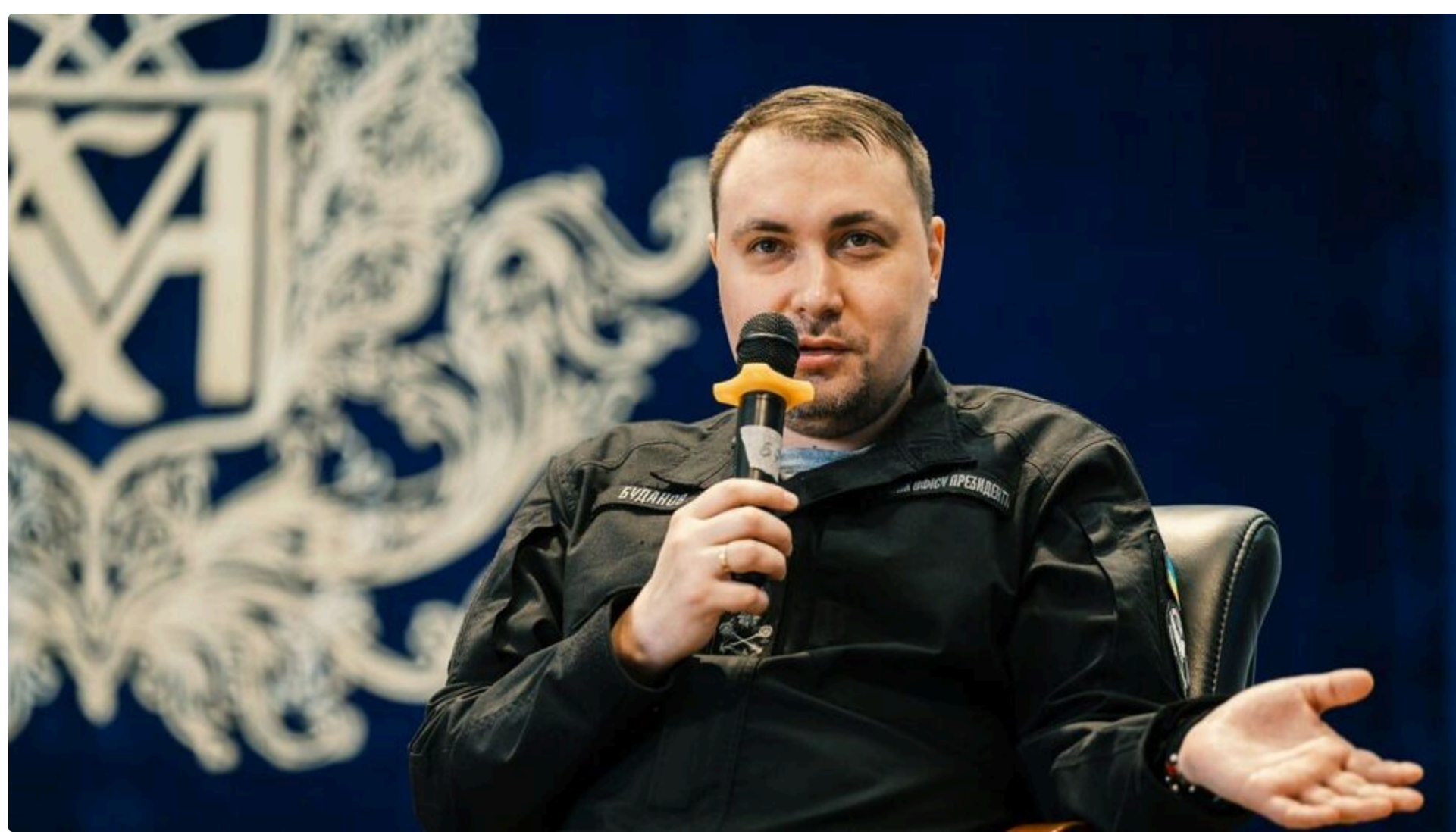
Глава ОП закликав якнайшвидше ухвалити законопроект

28 червня, 18.51 🗨️ Етот материал также можно прочитать на русском