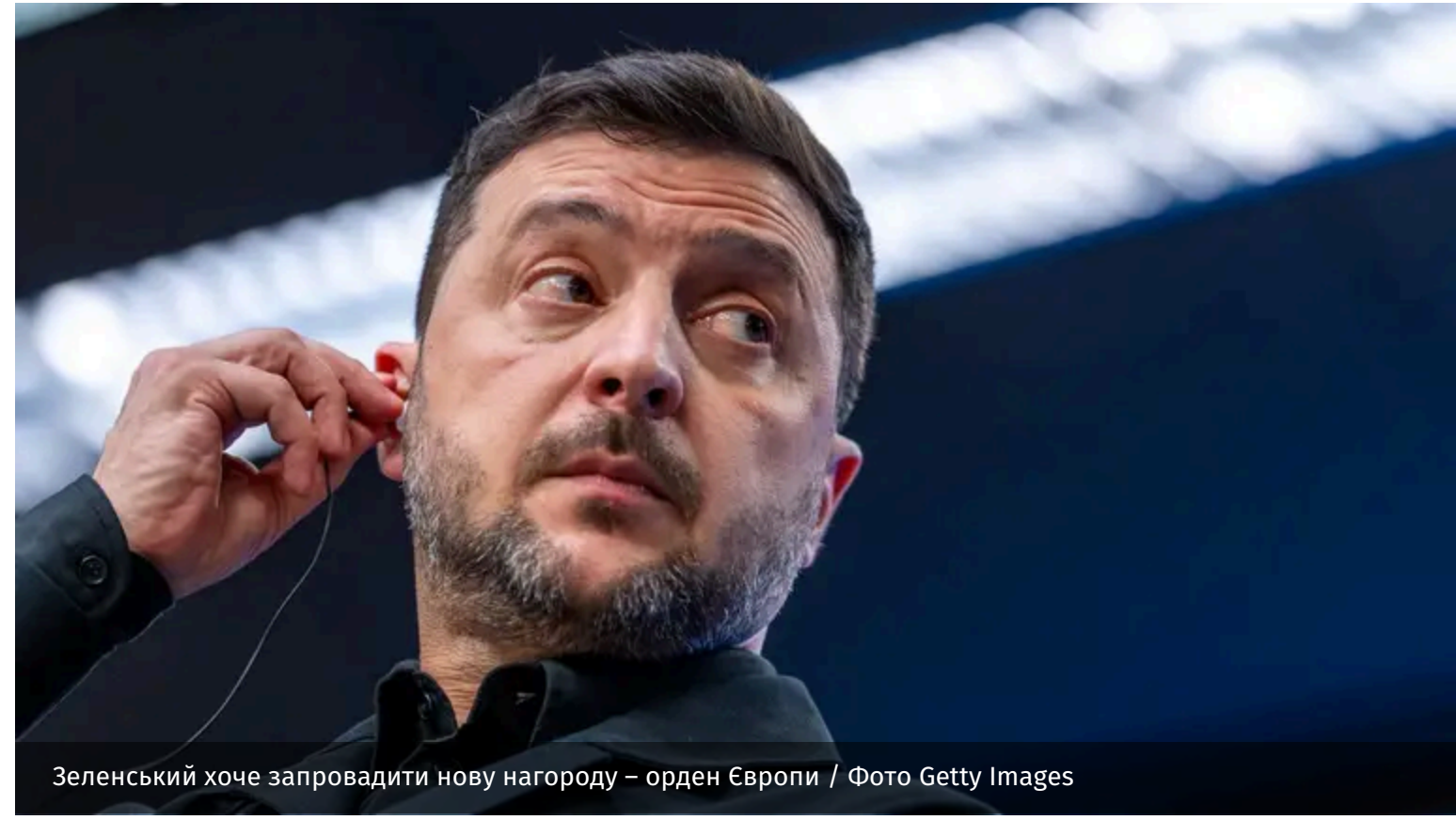
Зеленський хоче запровадити нову нагороду – орден Європи

Володимир Зеленський пропонує заснувати орден Європи. Відповідний законопроект президент подав до Верховної Ради.