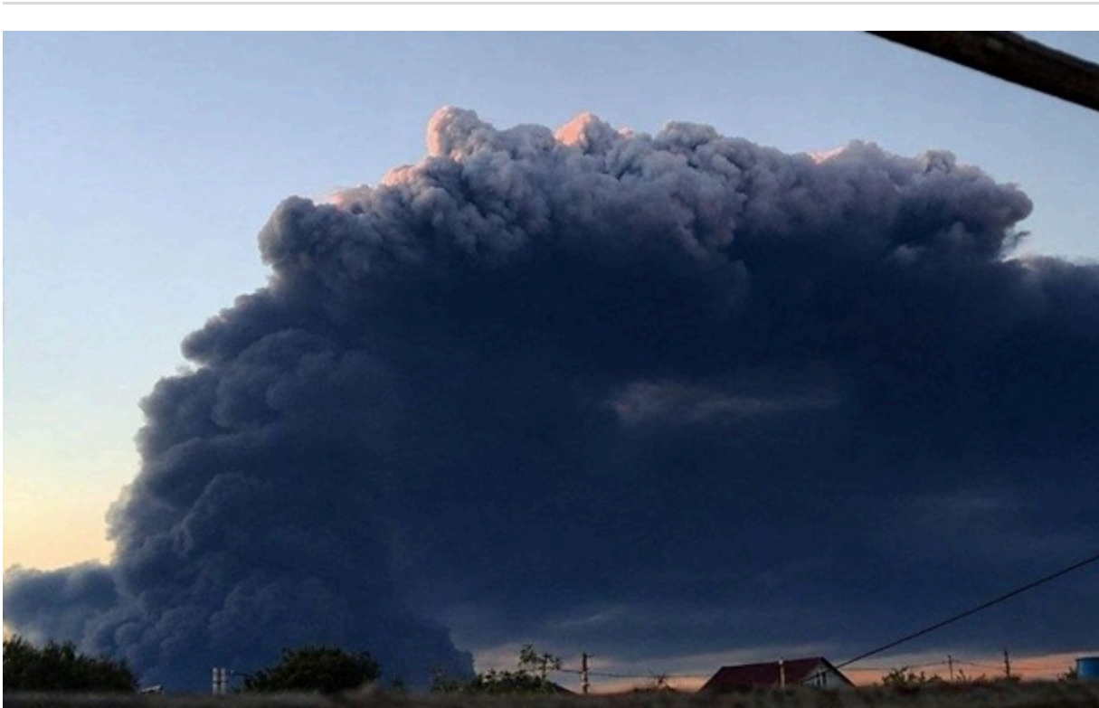
Дим від пожежі на НПЗ Слов'янський у Краснодарському краї

Кожна далекобійна санкція – це зменшення ресурсів, що працюють на російську воєнну машину, нагадав Володимир Зеленський.