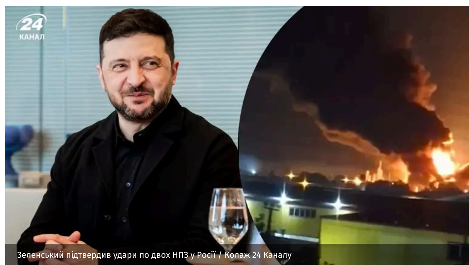
Зеленський підтвердив удари по двох НПЗ у Росії / Колаж 24 Каналу

Одразу два російські нафтопереробні заводи горять у Росії після нічної атаки. Володимир Зеленський пообіцяв нові відповіді на ворожий терор.