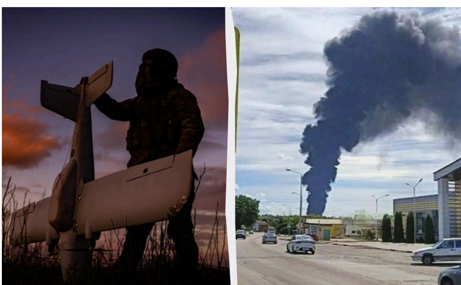
Війна триває

Військові називають свою роботу "українськими санкціями".