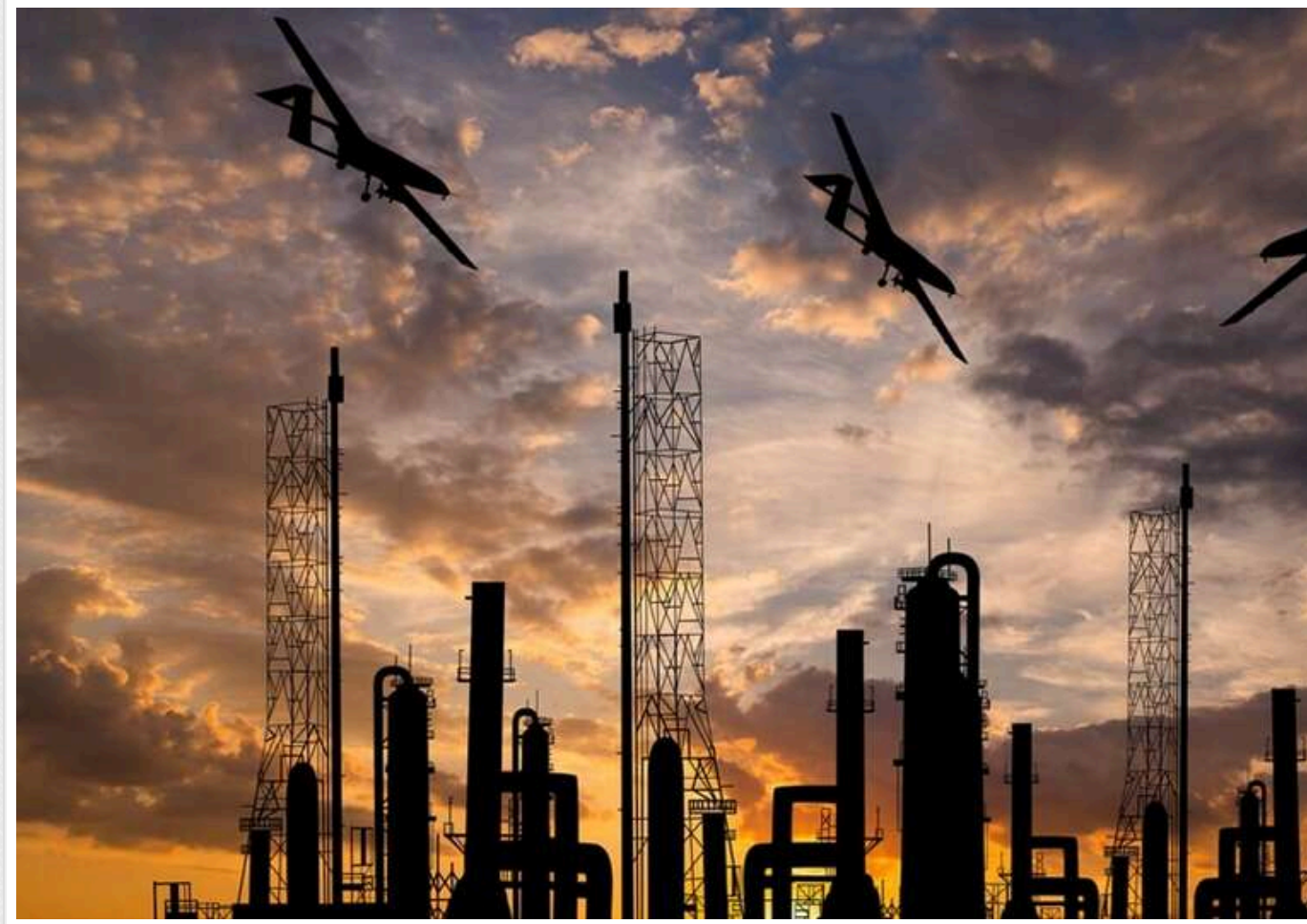
ЗМІ: Україна у червні здійснила рекордну кількість атак на російські військові заводи

Україна у червні здійснила рекордну кількість повітряних атак на підприємства російського військово-промислового комплексу. Головною ціллю стали заводи, що виробляють ракети, електроніку та боеприпаси.