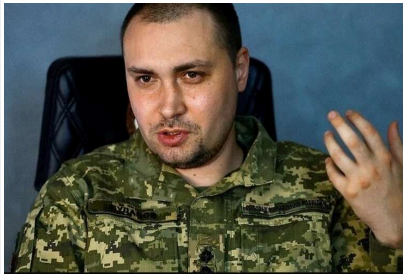
Буданов: Росія не зміниться сама, її імперські амбіції потрібно викоринити

Читати на русском Read in English Додати як бажане джерело в Google