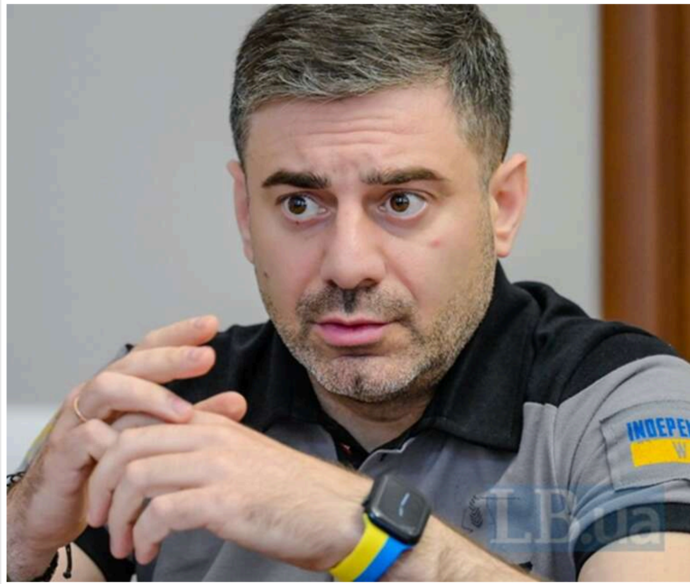
Дмитро Лубінець в ООН: Росія стратила 337 українських військовополонених, тортури стали державною політикою РФ

Уповноважений Верховної Ради України з прав людини Дмитро Лубінець поінформував про понад 300 страчених українських військовополонених.