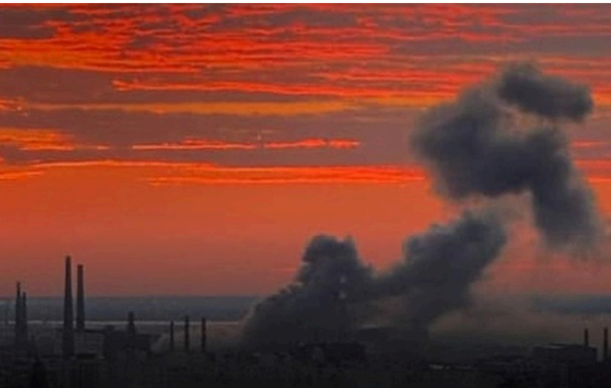
Ракети Фламінго уразили завод Титан-Барикади у Волгограді

Уражено важливе підприємство російського ВПК у Волгограді, засоби ППО та пором у Криму.