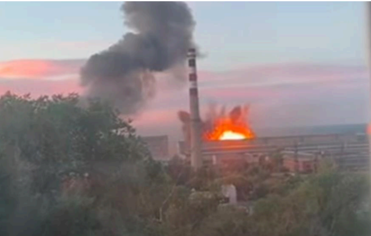
Завод Титан-Барикади у Волгограді атакували ракети Фламінго

Президент підтвердив успішне ураження ракетами Фламінго заводу Титан-Барикади у Волгограді.