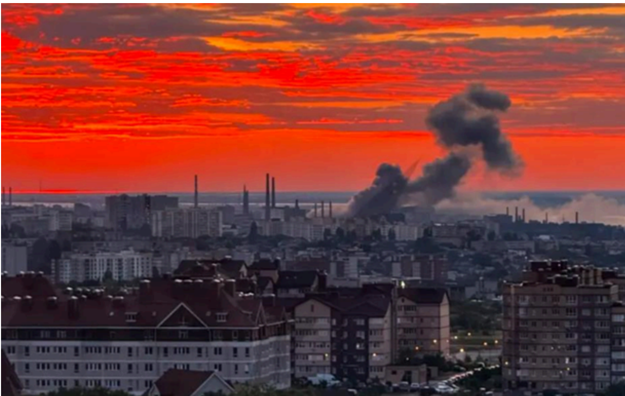
Завод Титан-Барикади у Волгограді атакували ракети Flamingo

Ракети Фламінго влучили у виробника Іскандерів. Попередньо, уражені три об'єкти на території заводу Титан-Барикади.