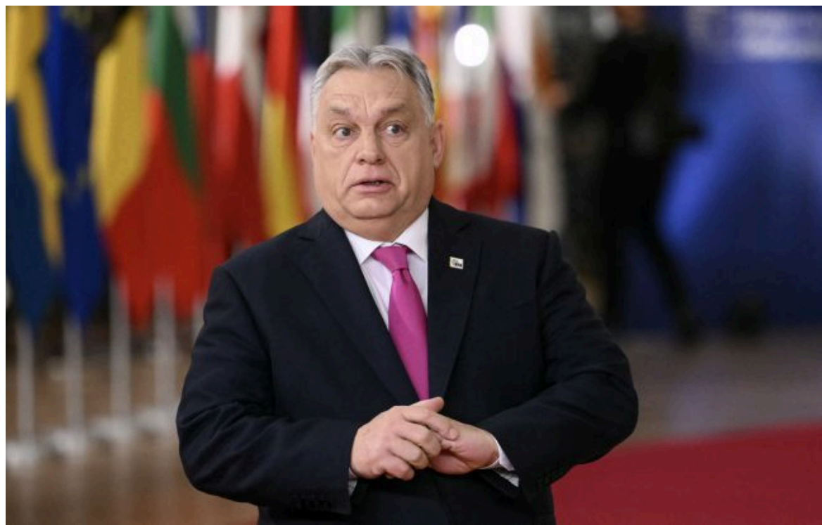
Фото: експрем'єр Угорщини Віктор Орбан (Getty Images)

Вимкни хаос міжнародних новин! Отримуй тільки важливе з РБК-Україна у Google