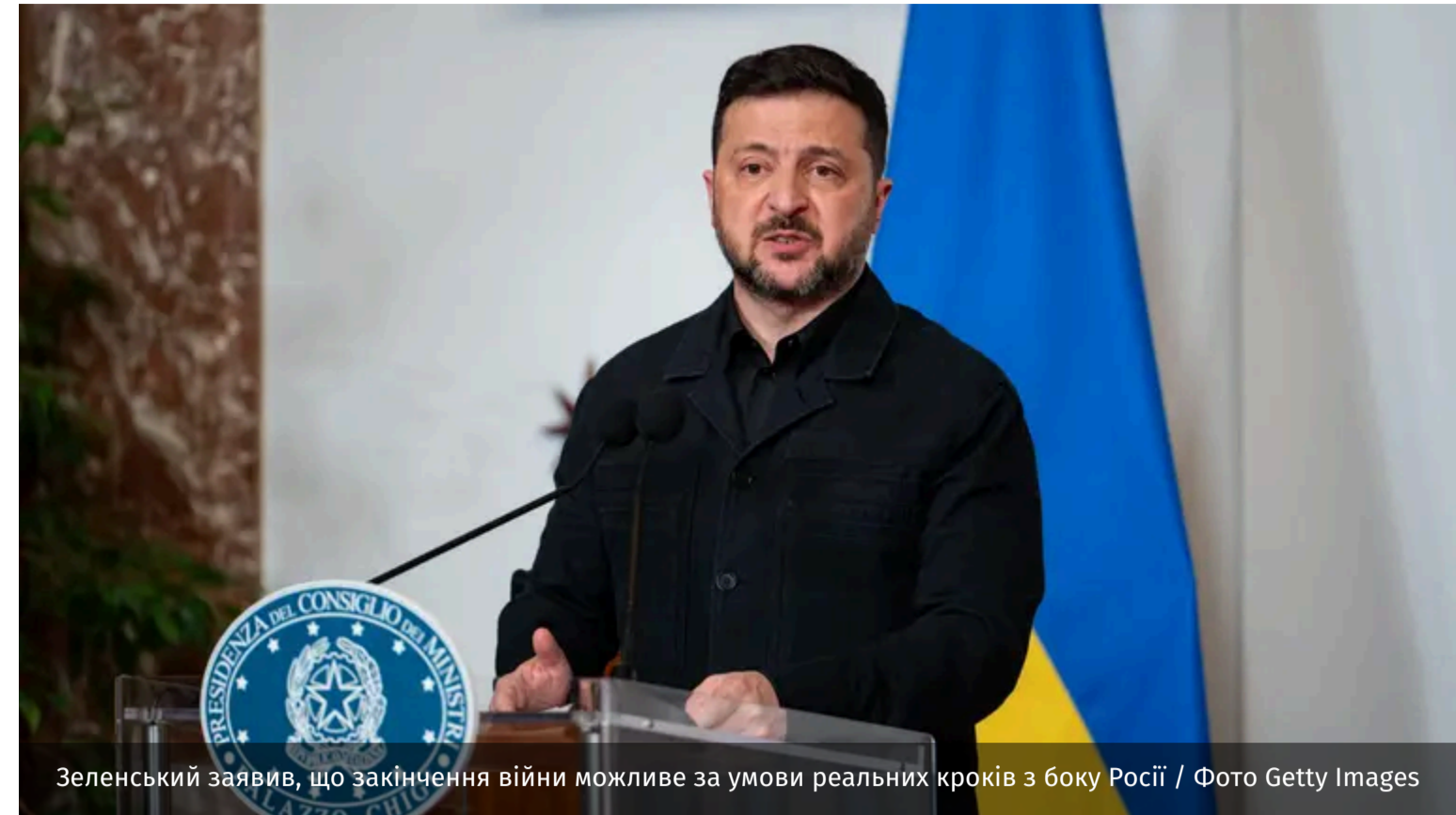
Зеленський заявив, що закінчення війни можливе за умови реальних кроків з боку Росії

Україна передала пропозиції щодо можливих переговорів не лише ключовим партнерам, а й країнам, які мають вплив на Росію. Київ наголошує, що завершення війни можливе, але для цього Москва має зробити реальний крок до миру.