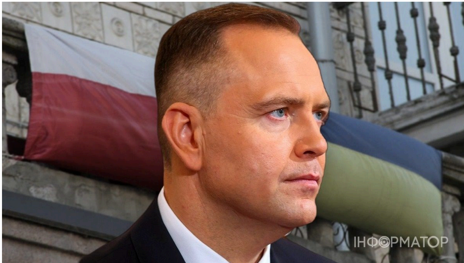
Навроцький побив рекорд довіри після скандалу з нагородою

Президент Польщі Кароль Навроцький очолив список довіри серед польських політиків із показником 54,8% - найвищим результатом за всю історію таких вимірювань. За місяць показник зріс на 8,4 відсоткового пункта - найбільший місячний стрибок у подібних опитуваннях. Збір даних тривав 19-21 червня, тобто збігся з оголошенням рішення про відкликання нагороди рішення про відкликання ордена Білого орла , врученого президенту України Володимирі Зеленському.