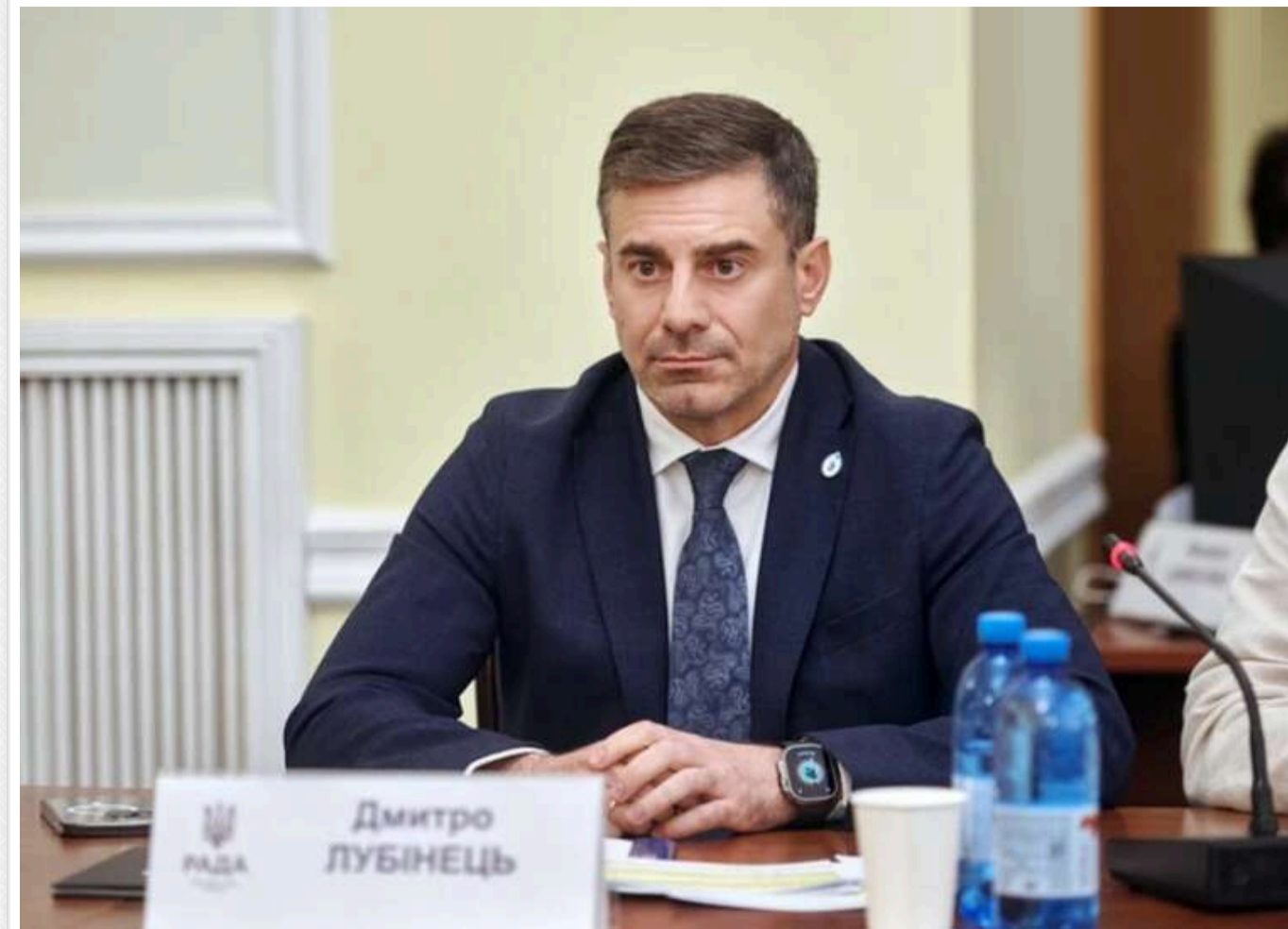
Лубінець зустрівся з російською омбудсменкою у Білорусі: говорили про повернення українців із полону

Читати на руском Додати як бажане джерело в Google