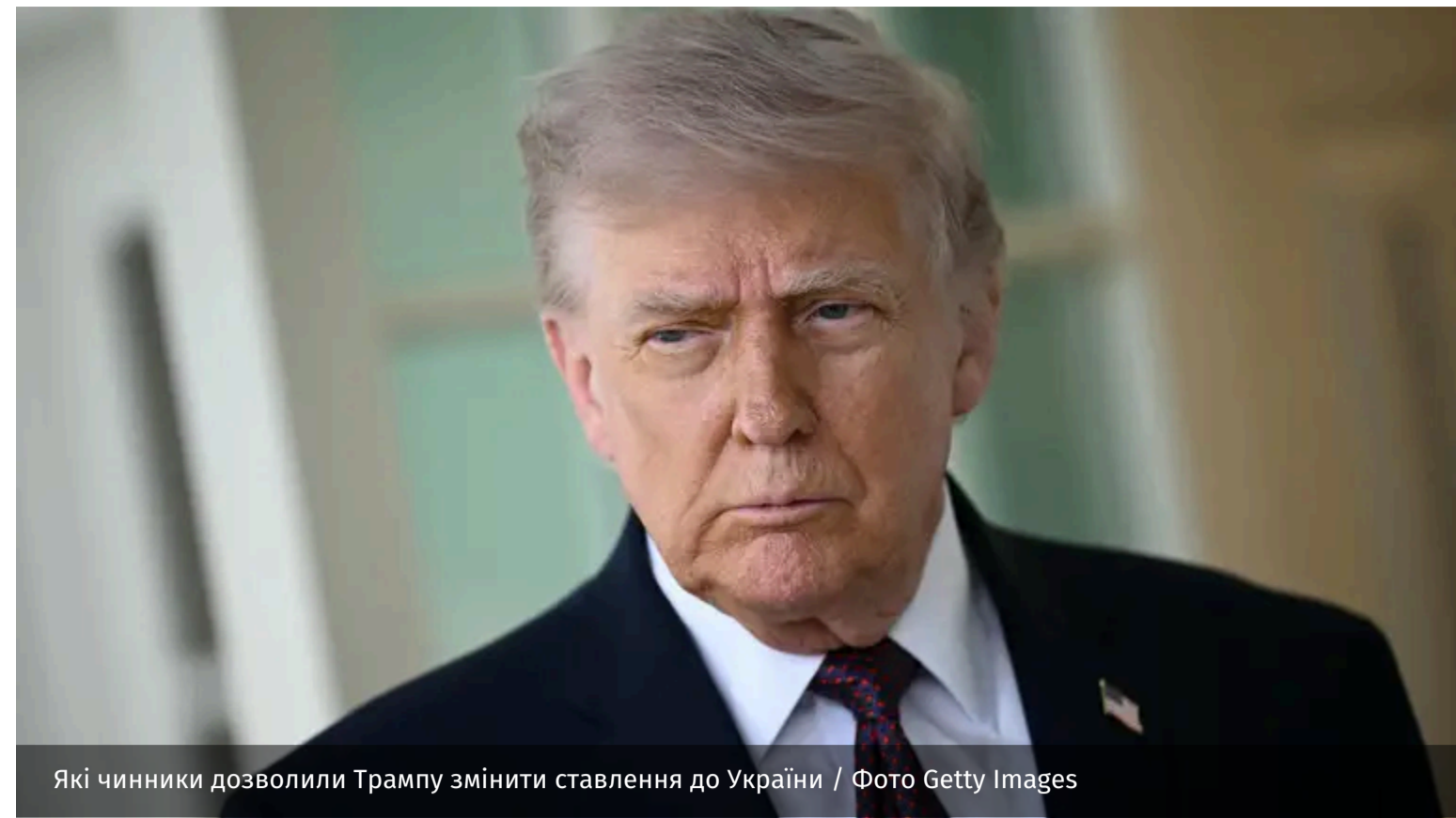
Які чинники дозволили Трампу змінити ставлення до України | Фото Getty Images

Участь Дональда Трампа у цьогорічному саміті G7 стала переламним моментом у його ставленні до України. Якщо раніше він дозволяв собі критикувати українську владу, то після спілкування на саміті з Володимиром Зеленським та європейськими лідерами він погодився на більш рішучу підтримку України.