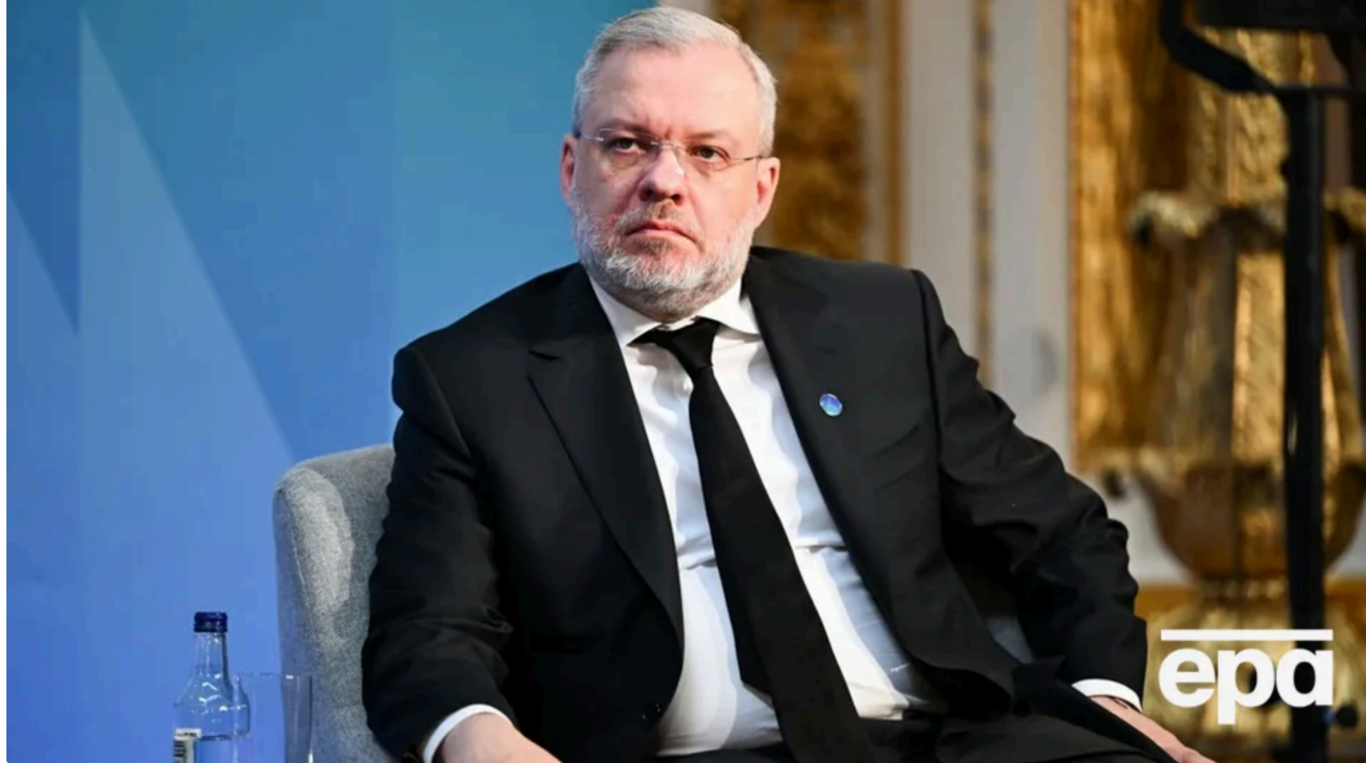
Три фірми внесли за Галущенко більше ніж 100 млн грн

За колишнього міністра енергетики Германа Галущенко, якого підозрюють у відмиванні коштів, внесли 105 млн грн застави з призначених судом 150. Про це 26 червня повідомили журналісти "Схем" (Радіо Свобода) із посиланням на джерела у правоохоронних органах.