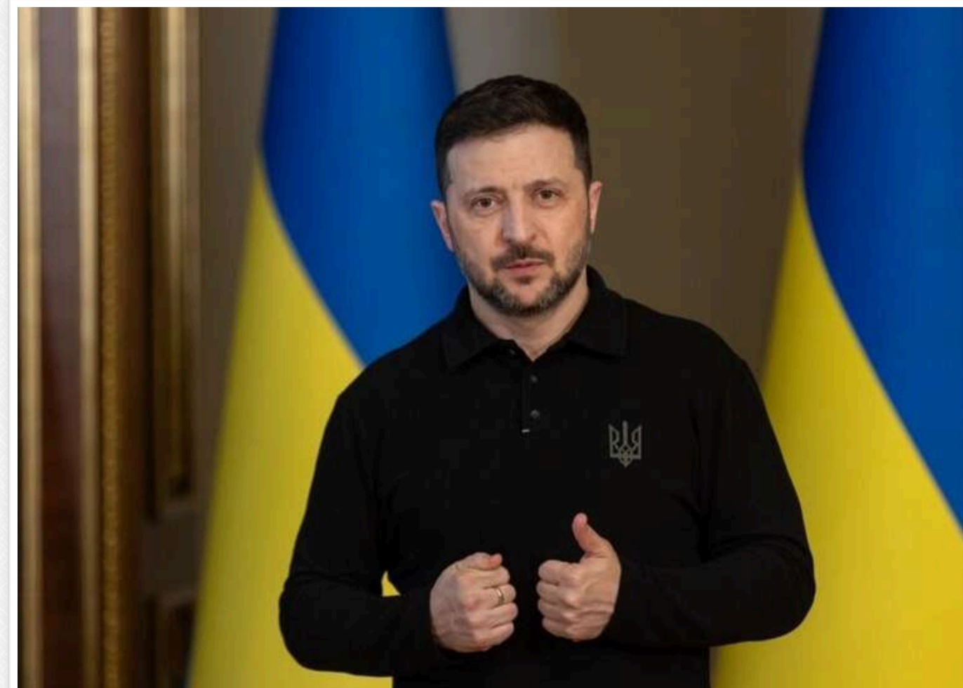
Зеленський: Україна ніколи не відмовиться від Криму та боротиметься за повернення всіх територій

Президент України Володимир Зеленський у День кримськотатарського національного прапора запевнив, що держава щодня б'ється за повернення всіх своїх окупованих територій і ніколи не відмовиться від Криму, з якого Росія у 2014 році розпочала свою агресію.