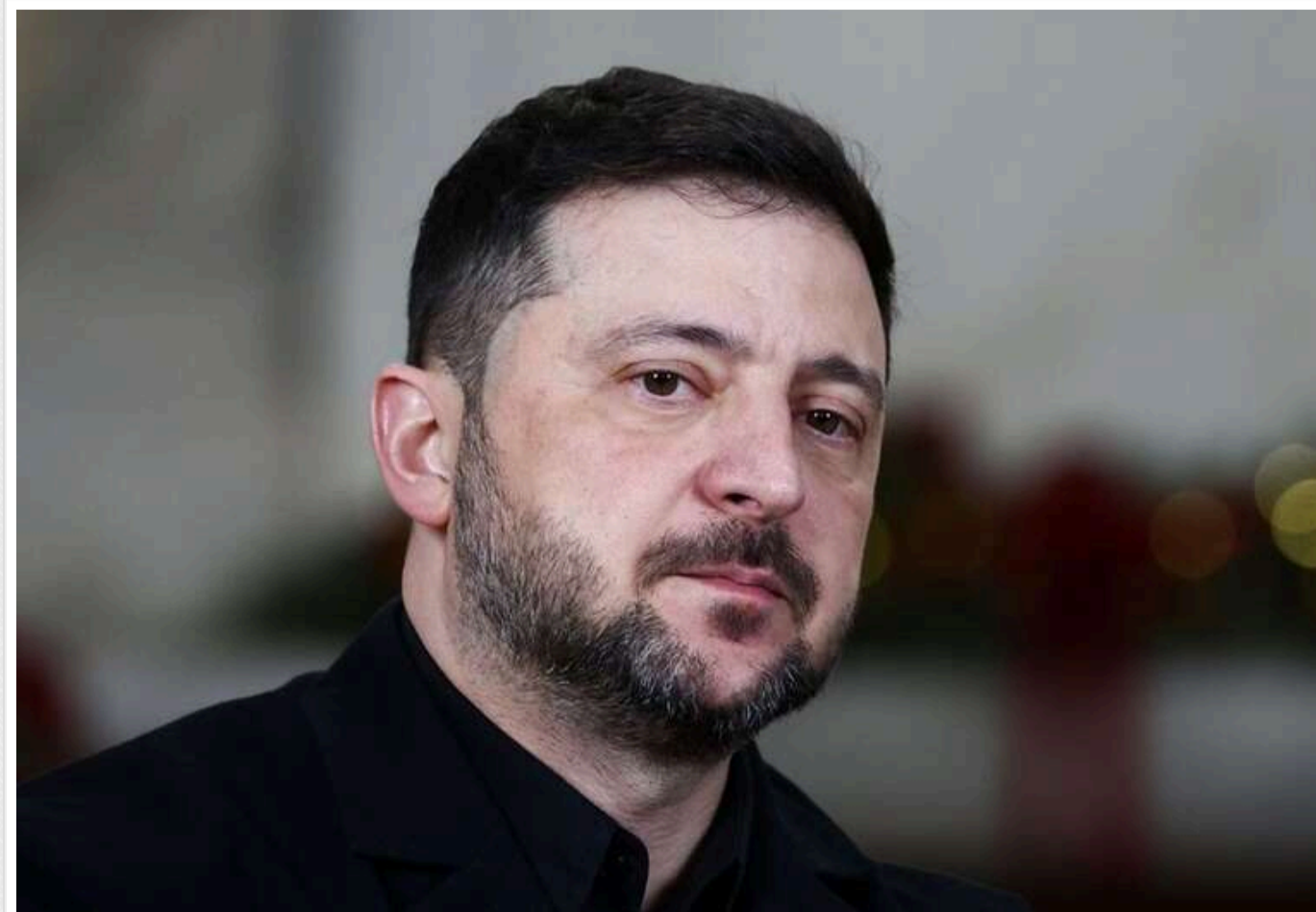
Зеленський: На конференції у Гданську Україна уклала 160 угод на понад 10 мільярдів євро

У п'ятницю, 26 червня, Володимир Зеленський заявив, що на конференції з відбудови у Гданську Україна уклала 160 угод на понад 10 млрд євро.