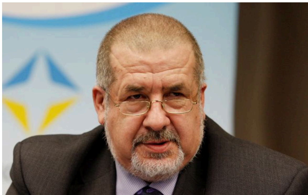
Фото: глава Меджлісу кримськотатарського народу Рефат Чубаров (Getty Images)