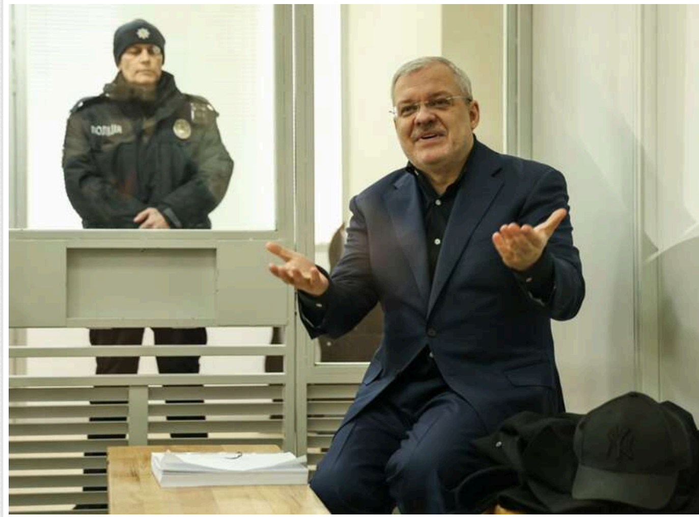
За ексміністра енергетики Галущенко внесли 105 мільйонів гривень застави, – ЗМІ

Читати на руском Read in English Додати як бажане джерело в Google