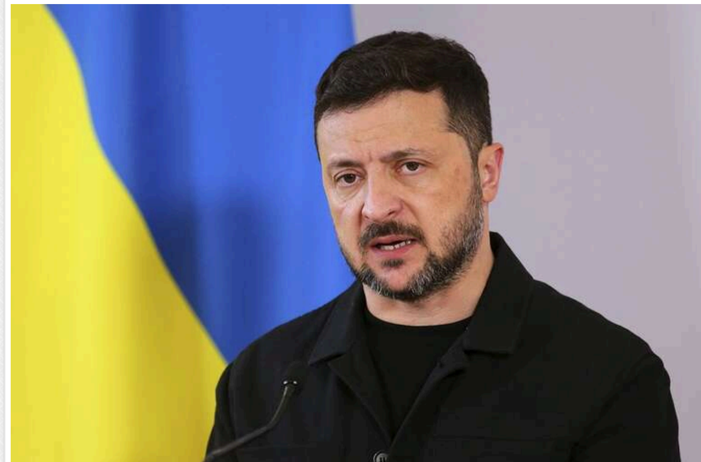
Зеленський: Україна готується до саміту НАТО в Анкарі та створення спільного європейського проєкту антибалістики

Україна готується до саміту НАТО та активізує дипломатичну роботу з партнерами в ЄС і Альянсі, зосереджуючись насамперед на посиленні ППО та створенні спільних антибалістичних проєктів.