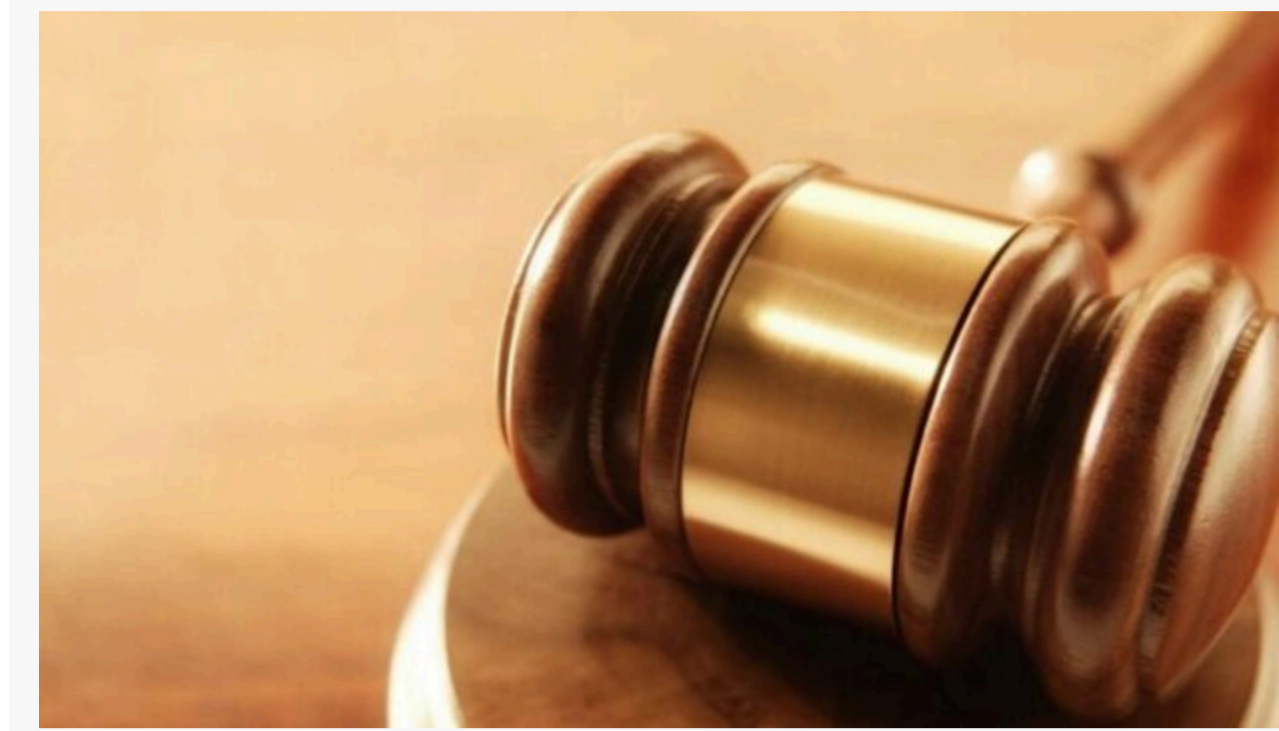
Суд.

Група Kernel Андрія Веревського через кіпрську компанію Etrescom Investments Limited намагається стягнути з державного "Сенс Банку" суму, еквівалентну 1,75 млрд грн.