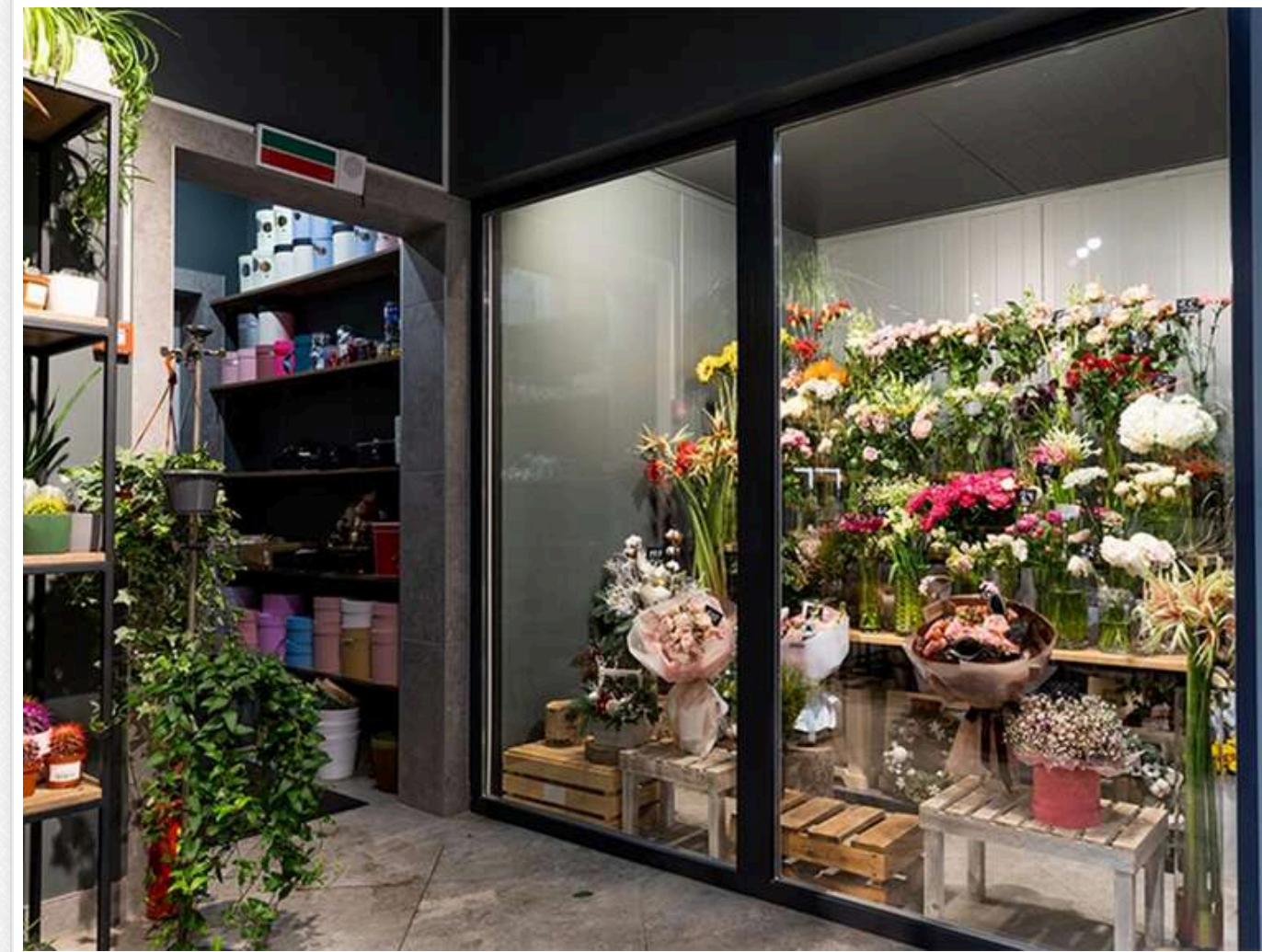
Троянди «в сіру»: Гетманцев заявив про контрабанду квітів на 1,6 мільярда доларів і мільярдні втрати бюджету

Ринок квітів в Україні на 78% перебуває в «тіні», а державний бюджет щорічно втрачає приблизно 2 мільярди гривень.