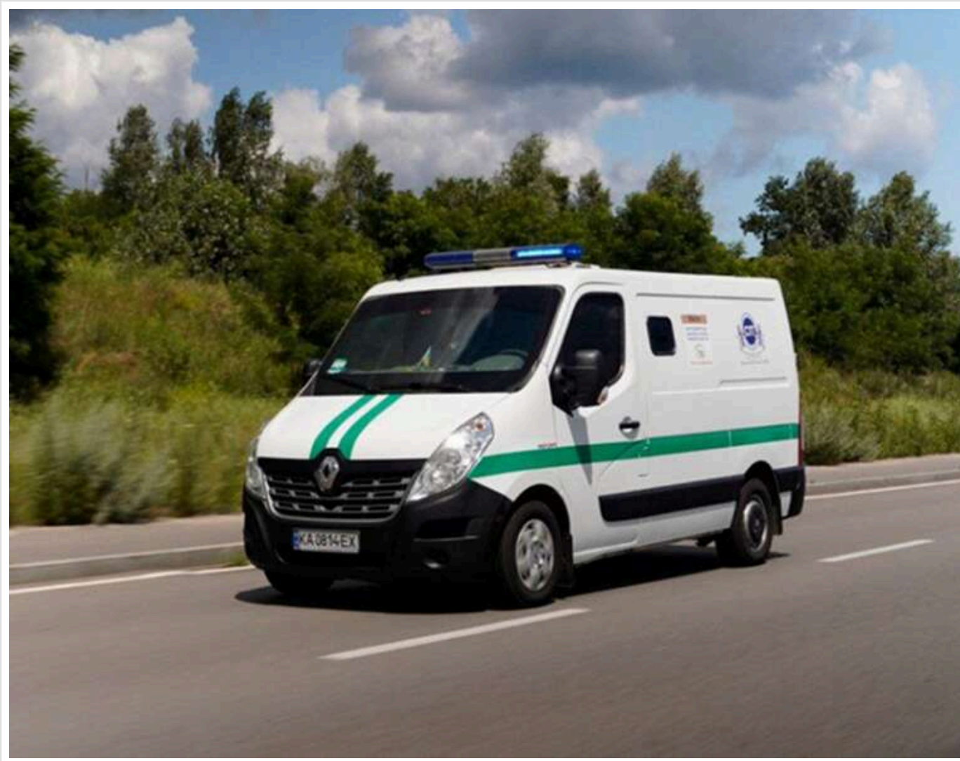
"Взяла 7 заручників та викрала гроші": Угорщина захопила інкасаторські авто "Ощадбанку"

Читати на руськом Read in English Додати як бажане джерело в Google