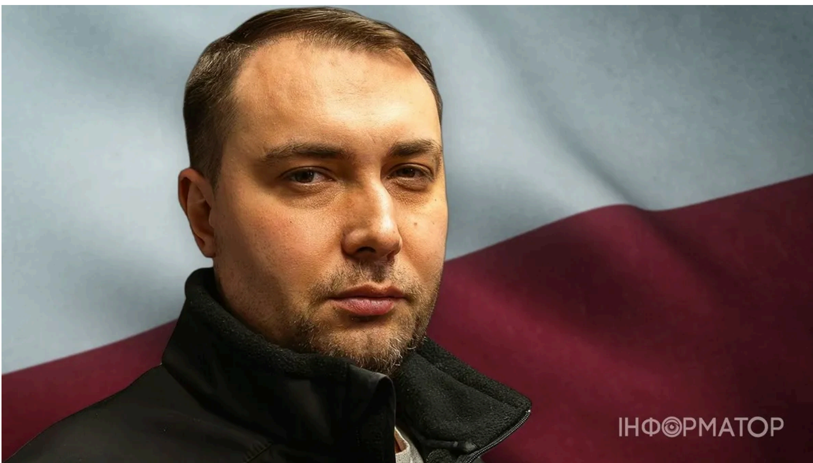
Буданов про відносини України та Польщі

Керівник Офісу президента України Кирило Буданов попередив, що напруга між Україною та Польщею ще не досягла свого піку і може перерости у щось серйозніше. Рішення президента Польщі Кароля Навроцького позбавити Володимира Зеленського ордена Білого Орла він назвав страшною помилкою і проявом незрілості. За його словами, саме від здатності обох сторін зупинитися залежить, чи не переросте ця суперечка у повноцінний конфлікт.