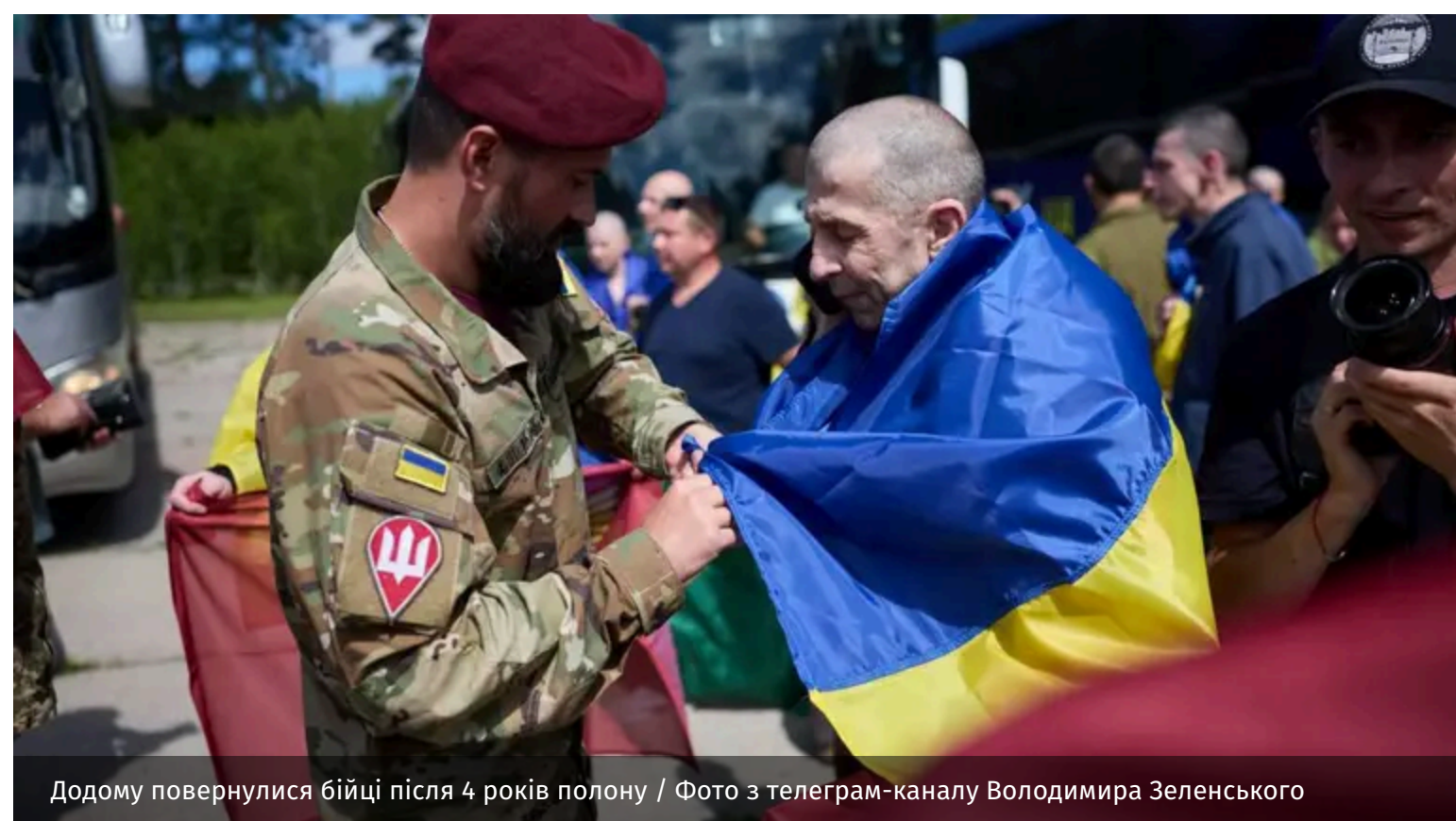
Додому повернулися бійці після 4 років полону

Україна провела черговий обмін полоненими, повернувши додому 160 своїх громадян. Майже всі звільнені потрапили в російський полон ще у 2022 році та провели в неволі понад чотири роки.