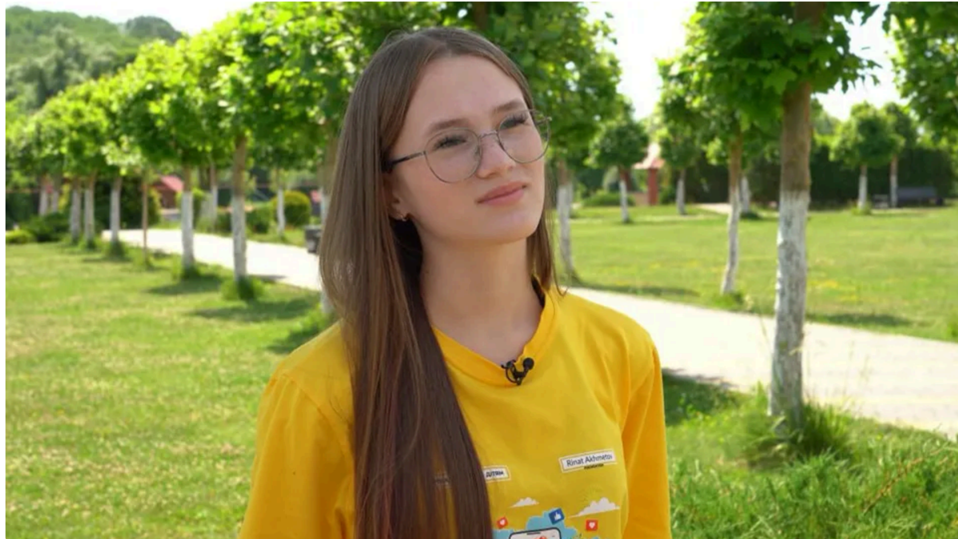
Учасники "Блогер Кемпу" зазвичай мають досвід життя в окупації, втрати домівки й рідних

Табір "Блогер Кемп" організовано Фондом Ріната Ахметова для дітей, які постраждали від війни. Минула перша літня зміна кемпу, повідомив сайт Фонду.