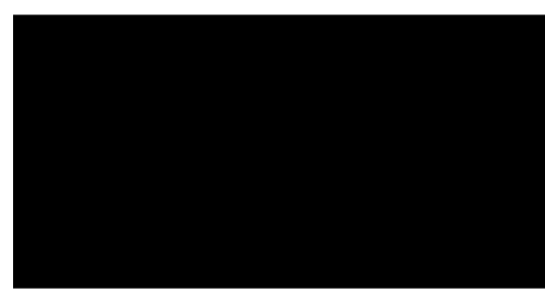
Гроші впадуть з неба після того, як прочитаєш це