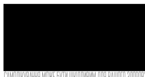
САМОЛІКУВАННЯ МОЖЕ БУТИ ОПИШЛИМ ДЛЯ ВАШОГО ЗДОР'Я Якщо з'явилися варикозні вени або синошні вузли, застосуйте це