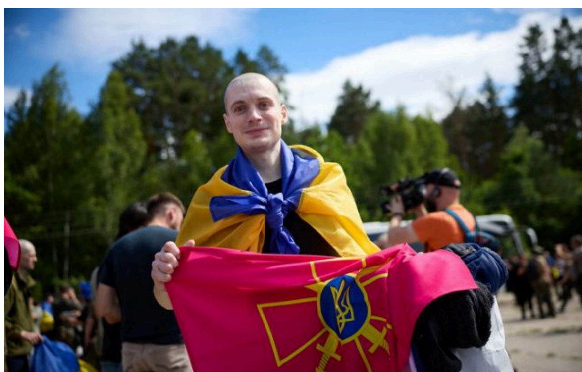
Фото: відбувся обмін полоненими (Lme/V_Zelenskiy_official)