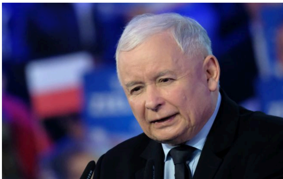
Фото: Ярослав Качинський, польський політик (Getty Images)