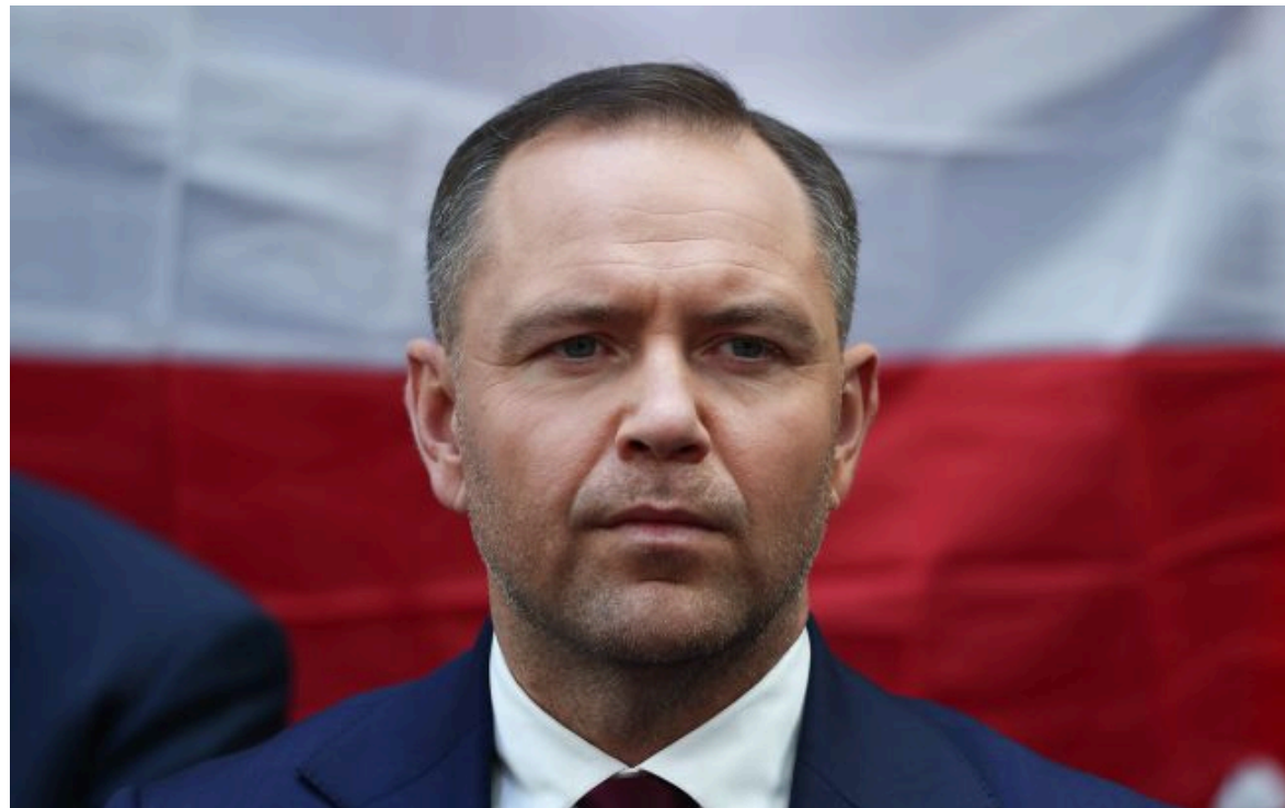
Фото: Кароль Навроцький (Getty Images)