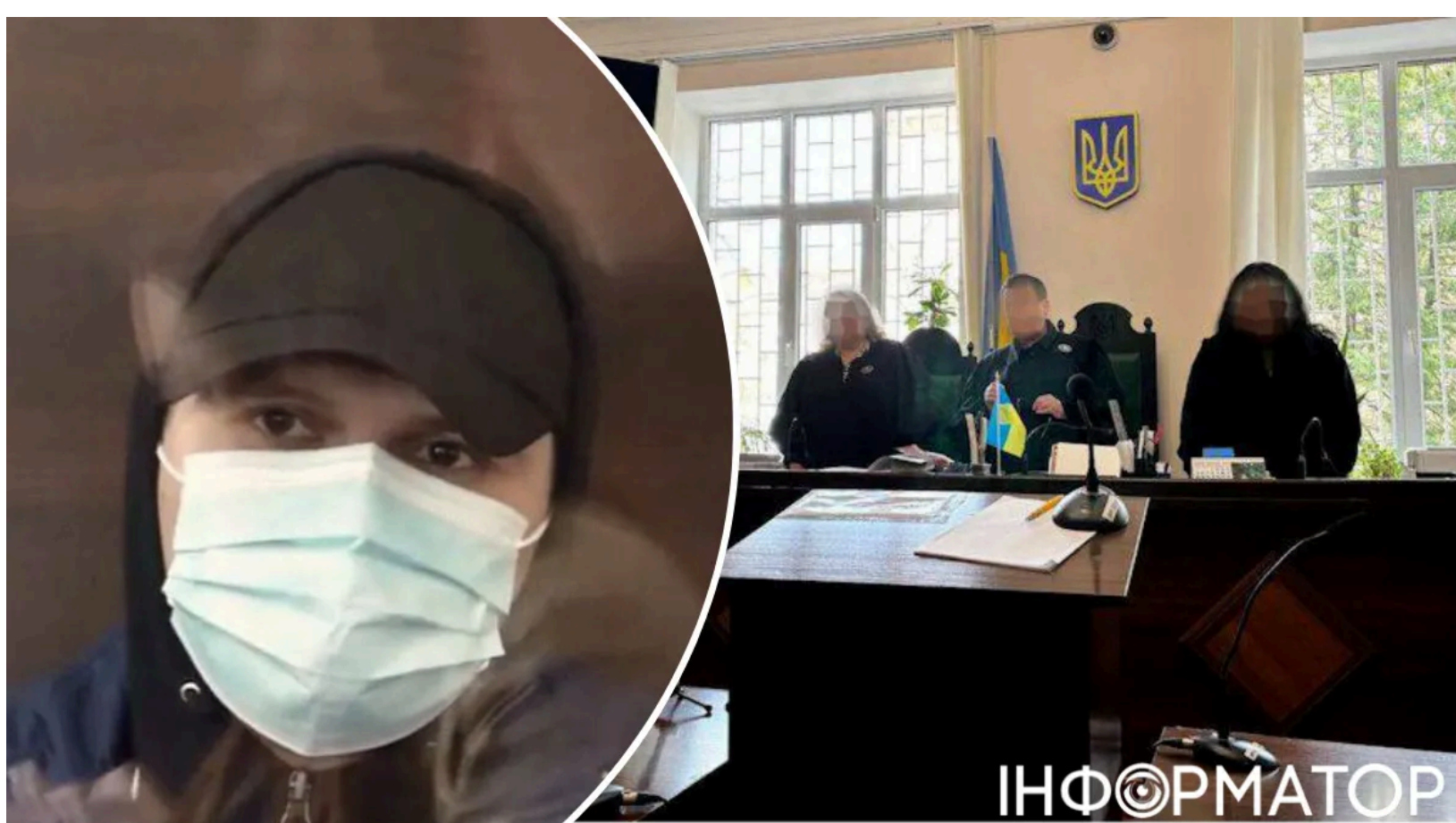
Житомир'янин вбив матір і доньку

Верховний Суд поставив остаточну крапку в резонансній справі про жорстоке вбивство жінки та її 13-річної доньки у Житомирі. Засуджений, якому призначено довічне позбавлення волі з конфіскацією майна, до останнього намагався уникнути відповідальності - перекладав провину на іншу людину, та прокурорам вдалося спростувати цю версію в усіх судових інстанціях. Злочин, скоєний у стані наркотичного сп'яніння, суд визнав таким, що виключає будь-яке пом'якшення покарання.