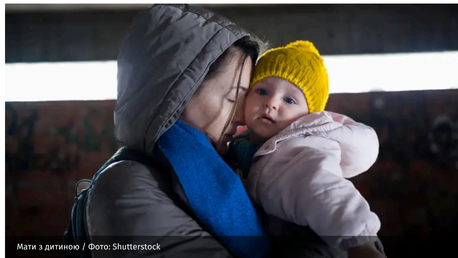
Мати з дитиною / Фото: Shutterstock

Аби країні стати наддержавою, їй треба мати значну кількість населення. Це обов'язковий фактор для того, аби вона була потужною. Без нього не буде змоги створити сильну економіку.