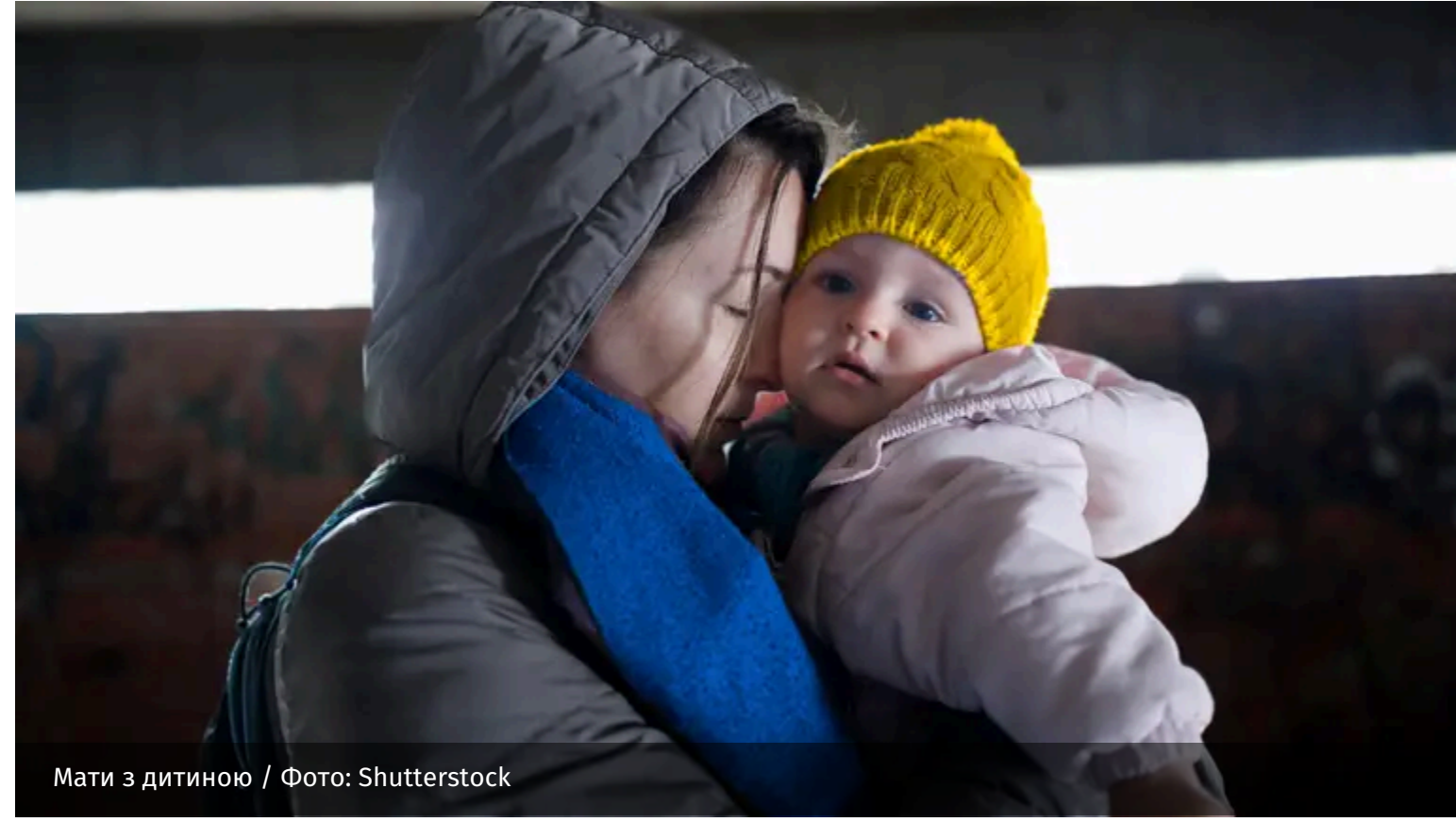
Мати з дитиною

Аби країні стати наддержавою, їй треба мати значну кількість населення. Це обов'язковий фактор для того, аби вона була потужною. Без нього не буде змоги створити сильну економіку.