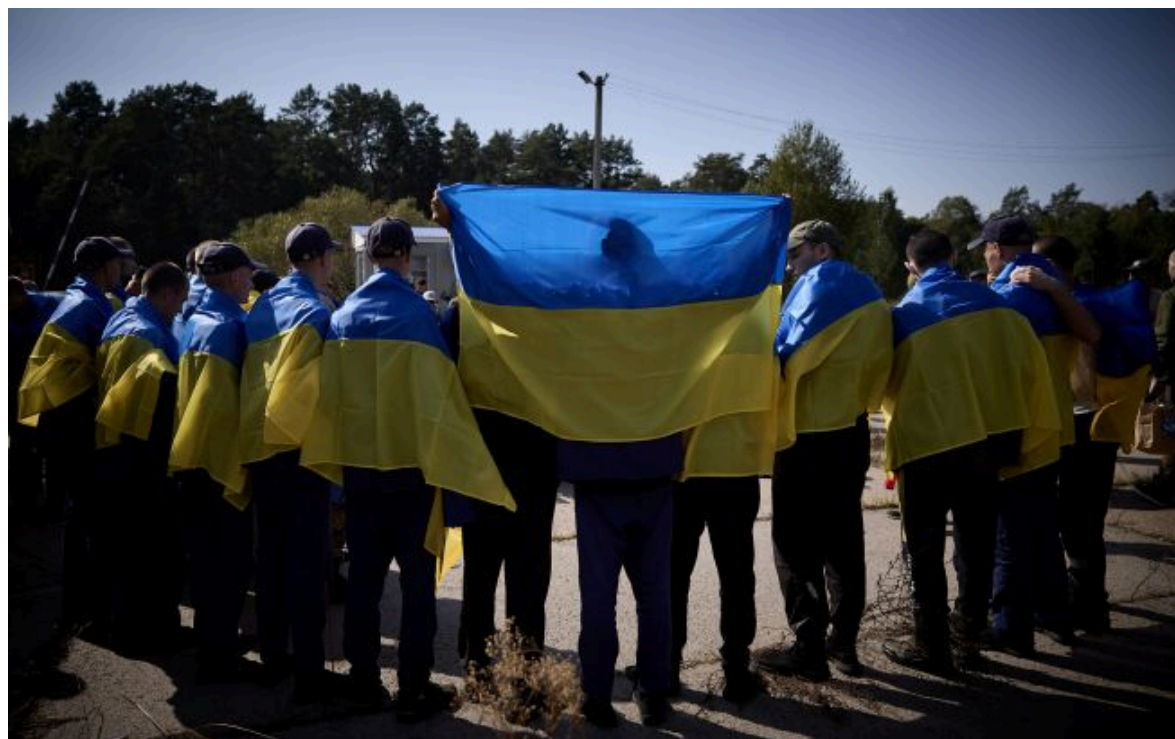
Фото ілюстративне: обмін полоненими