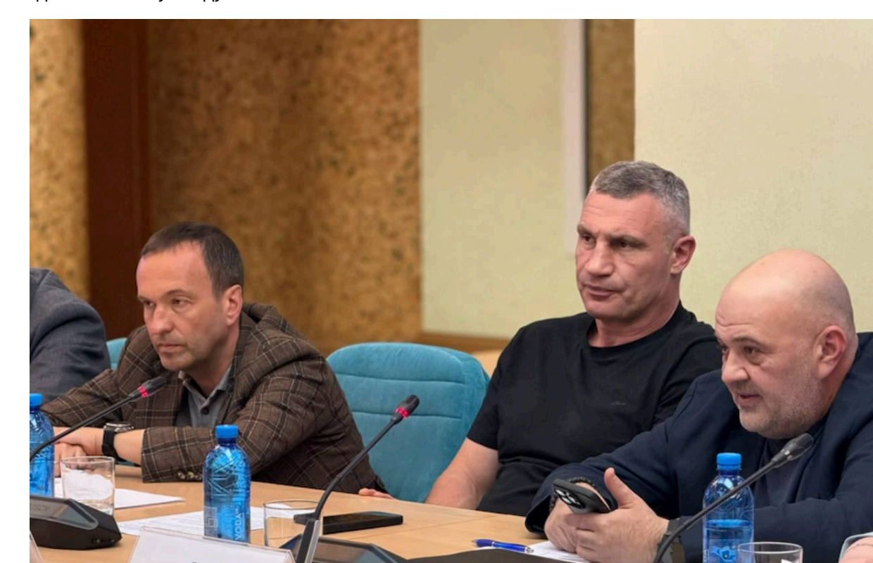
Міський голова Києва Віталій Кличко на нараді щодо теплопостачання столиці, яку навесні 2026 року відрізувало керівництво міської військової адміністрації

Переторрити КМДА на військовою адміністрацією означало б позбавити обраного мера Кличка влади. Тому в Києві виникла унікальна ситуація доволаддя: міська ВА Тимюра Ткаченка діє паралельно з адміністрацією мера. Звідси й постійне тертя за повноваження та бюджет столиці. Окремі сприймають це доволаддя як один із проявів давньої спроби Офісу президента підміняти під себе міську владу.