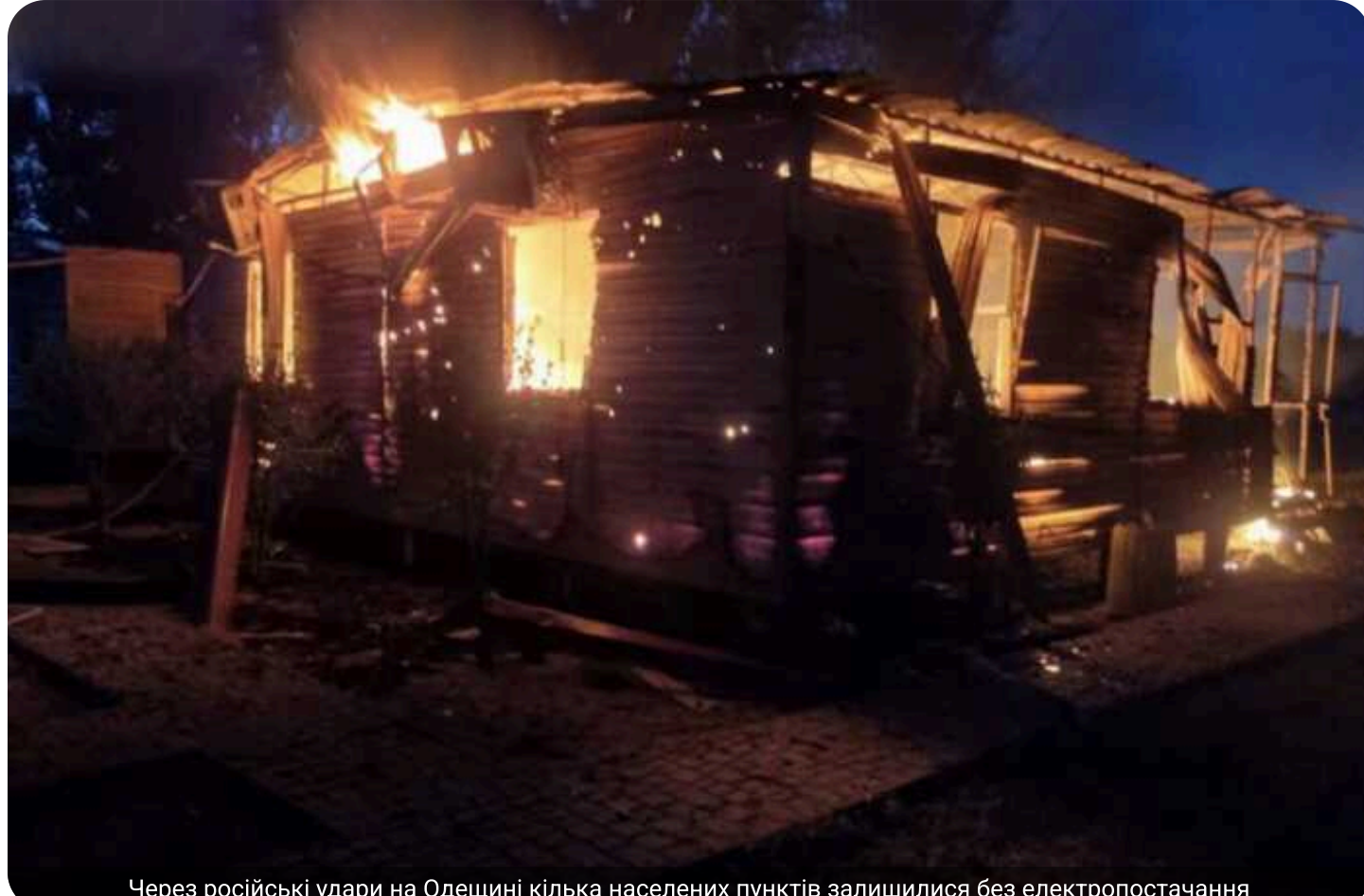
Через російські удари на Одещині кілька населених пунктів залишилися без електропостачання

Уночі 26 червня Росія атакувала енергетику і цивільну інфраструктуру Одеської області. В Ізмайльському районі знеструмлено кілька населених пунктів.