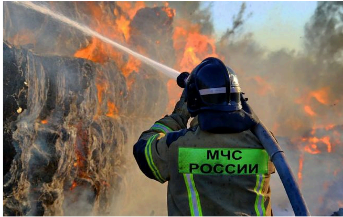
Фото: місцева влада атаку ніяк не коментувала