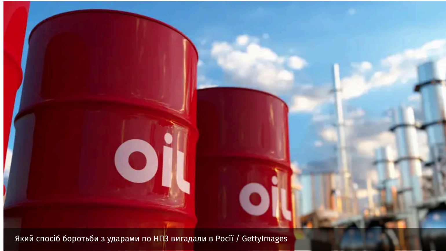
Який спосіб боротьби з ударами по НПЗ вигадали в Росії

Росія розглядає кілька варіантів подолання паливної кризи: розконсервацію стратегічних резервів палива, накопичених у попередні роки та закупівлю додаткових обсягів в інших країнах. Крім того, Москва вже понизила якість палива.