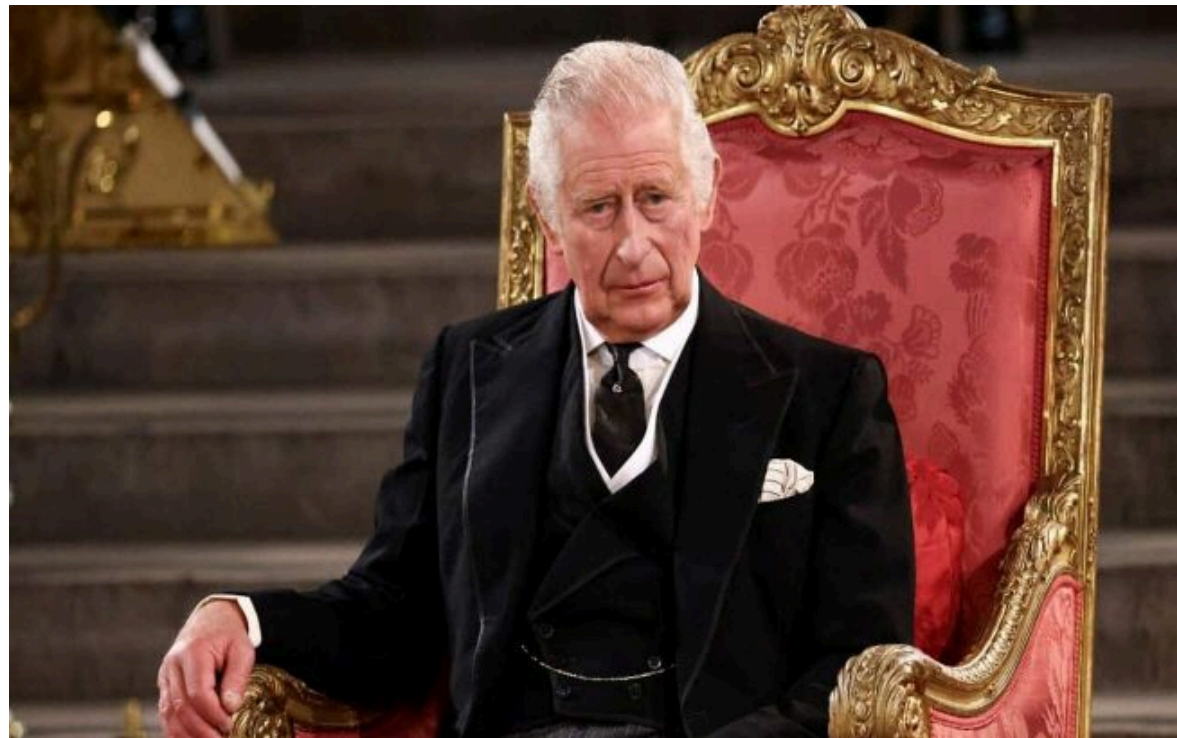
Фото: король Чарльз III