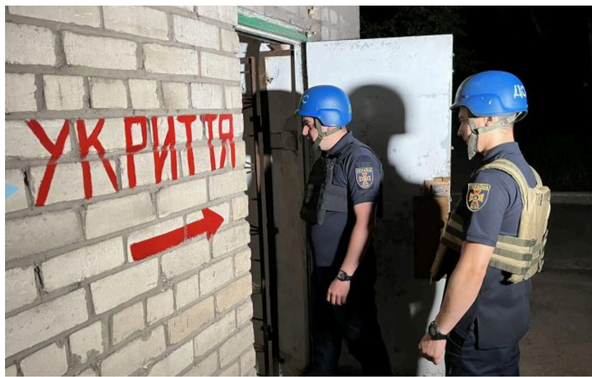
Фото: наслідки поки невідомі (facebook.com/UA.National.Police)